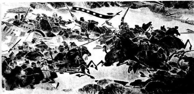
► 春秋战国时期的骑兵

中国在春秋时代以前作战以车战为主，步兵仅起辅助作用，兵车的数量多少成为军事实力的象征，基本没有骑兵这一兵种。而到战国时期一般讲到国家军事实力时往往是“车骑”并提，足可见当时的骑兵已和车兵并列为重要的技术兵种。《战国策》提到苏秦游说秦王，说秦国有“战车万乘，奋击百万”“以大王之贤，士民之众，车骑之用，兵法之教，可以并诸侯、吞天下”。范雎也说“秦卒之勇，车骑之多”，所向无敌。与“车骑”对称的“奋