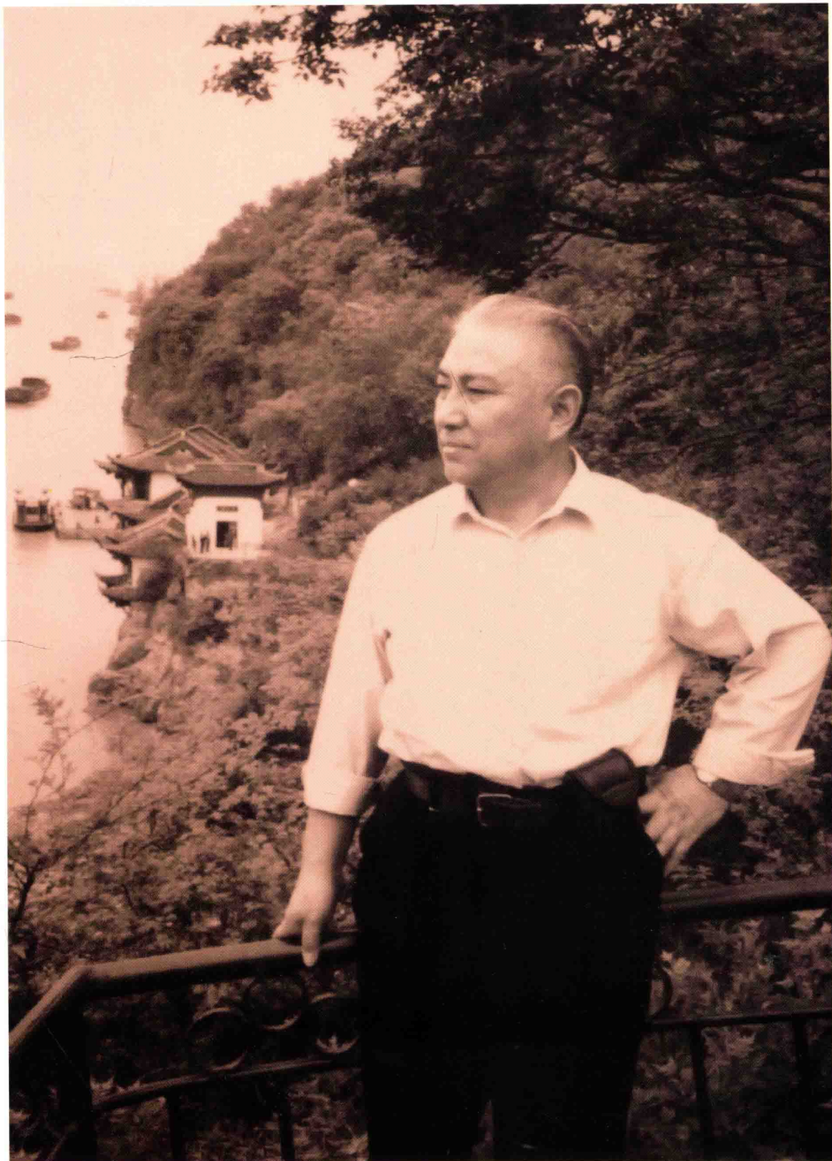
采石矶上携琴游，一曲“欸乃”合碧流。春山初醒心神醉，纵情山水胜公侯。