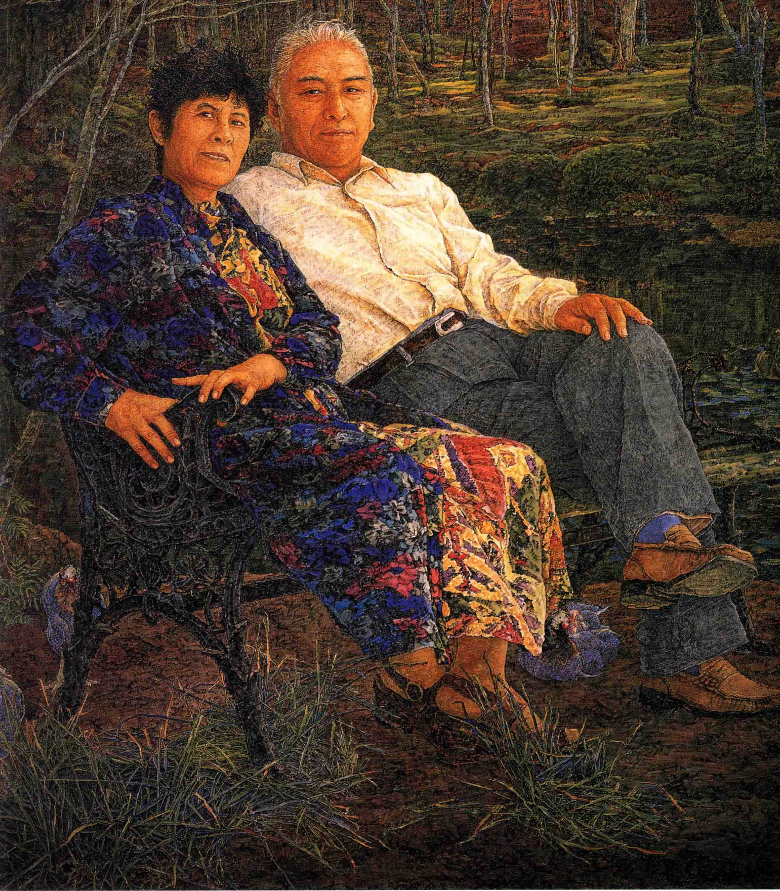
碧绿的池塘（又名：我的父亲母亲） 李蒸蒸 2005年