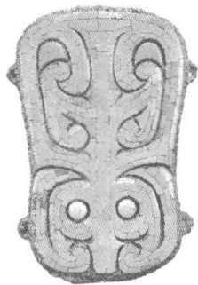
二里头文化青铜牌饰