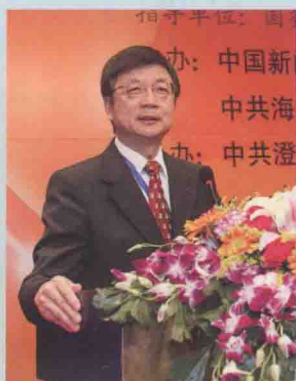
时任中国新闻社社长刘北宪致辞