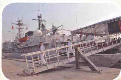
2014年5月18日，中新社记者采访报道中国“郑和舰”造访印度维沙卡帕特南港。