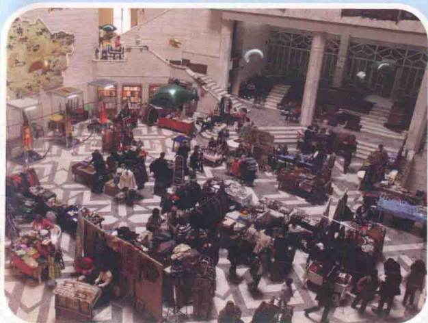
2014年6月，中新社记者采访哈萨克斯坦国家博物馆“丝绸之路”手工艺品展销会现场。来自哈萨克斯坦、乌兹别克斯坦等国手工艺品参展商带来了多种充满独特文化的产品。