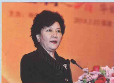
国务院侨办主任裘援平致辞

国务院侨办主任裘援平、中共福建省委常委、宣传部长李书磊、国务院侨办副主任何亚非、福建省副省长郑晓松、时任中国新闻社社长刘北宪、中共泉州市委书记黄少萍等嘉宾举行集体启动仪式。