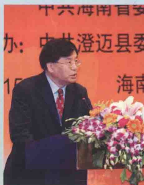
时任中国新闻社总编辑章新新主持论坛