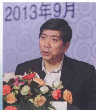
商务部国际贸易经济合作研究院院长霍建国做专题演讲