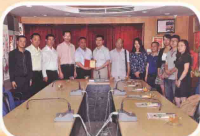
2014年7月，中新社报道组在泰国曼谷采访当地多位侨领。