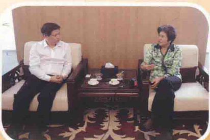
2014年7月，印尼雅加达，中新社记者采访中国驻东盟特命全权大使杨秀萍。