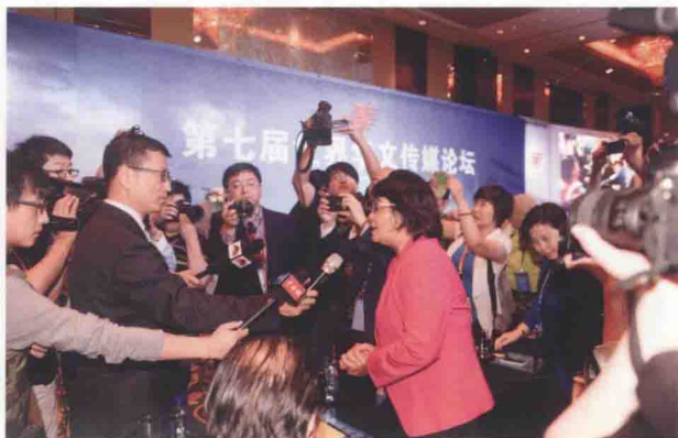
中央电视台著名主持人白岩松采访海外华文媒体老总