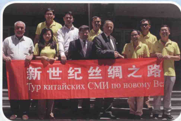
中新社报道组在塔吉克斯坦杜尚别采访当地学者

2014年2月起，中国新闻社率先启动“新世纪丝绸之路华媒万里行”采访行动，陆续派出六路记者分赴越南、老挝、孟加拉国、印度、缅甸、泰国、马来西亚、印尼、文莱、哈萨克斯坦、吉尔吉斯斯坦、塔吉克斯坦等东南亚、南亚及中亚国家进行采访。