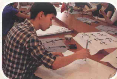
2014年6月，中新社记者在乌兹别克斯坦塔什干采访，当地孔子学院的学生正在学写毛笔字。