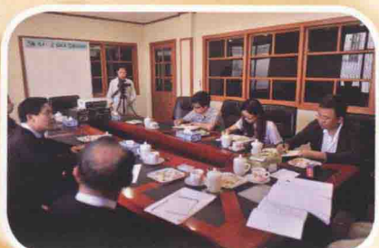
2014年5月22日，中新社记者在缅甸仰光采访中缅友好协会。