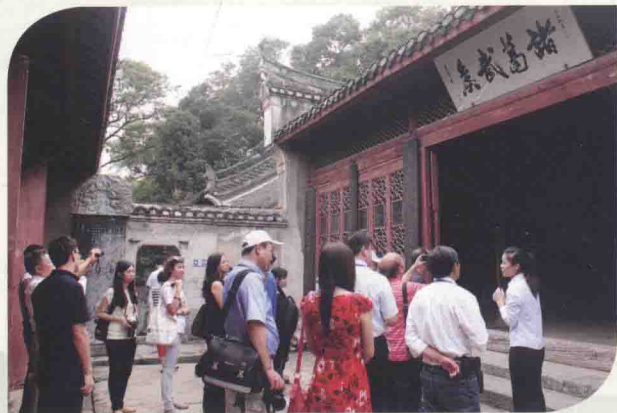
参观湖北襄阳古隆中武侯祠