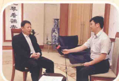
2014年7月10日，中国驻新加坡大使段洁龙接受中新社记者采访。