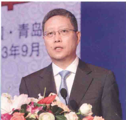
国务院侨办副主任何亚非在闭幕式致辞