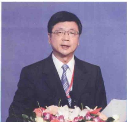
时任中国新闻社社长刘北宪作题为《中国梦——世界变局与华文媒体的新使命》的主旨报告。