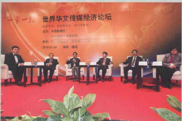
“一带一路”旅游合作对话会