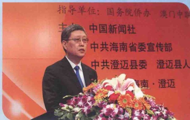
国务院侨办副主任何亚非致辞