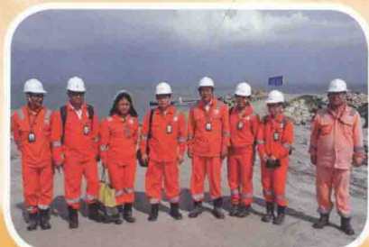
2014年8月，中新社报道组在文莱大摩拉岛采访中国民营企业海外大型投资项目。