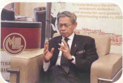
2014年7月7日，马来西亚国际贸易与工业部部长穆斯塔法·穆罕默德在吉隆坡接受中新社记者采访。