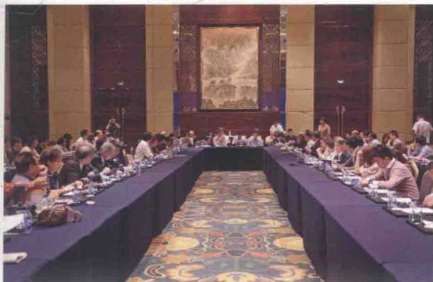
代表在论坛分会场讨论