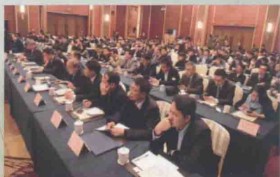
来自20多个国家的70余家海外华文媒体代表、丝绸之路沿线国家代表等300余人出席活动。