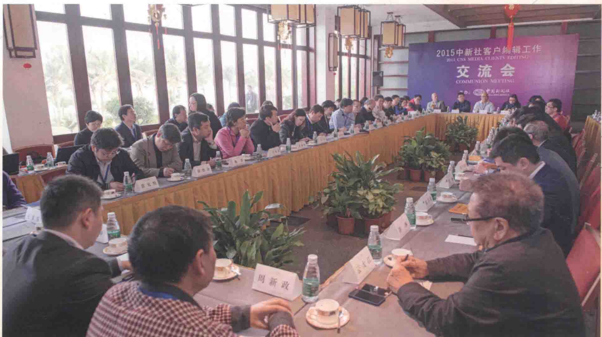
2015年1月24日，“2015中新社客户编辑工作交流会”在海南澄迈县举行。

中国新闻社于2014年、2015年分别在福建泉州、海南澄迈举办了中新社客户编辑交流会，探讨如何为海外受众提供更好的新闻产品和服务。