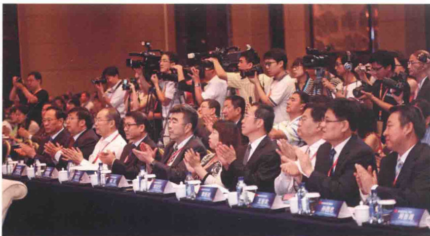
本次论坛吸引了来自58个国家和地区的约450名海外华文媒体代表以及中国内地媒体负责人、传媒专家等600余位嘉宾参加。