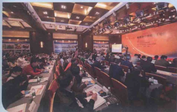
2015年1月24日，由中国新闻社和中共海南省委宣传部共同主办的“一带一路”世界华文传媒经济论坛在海南澄迈举行，200余位海内外代表参加论坛。