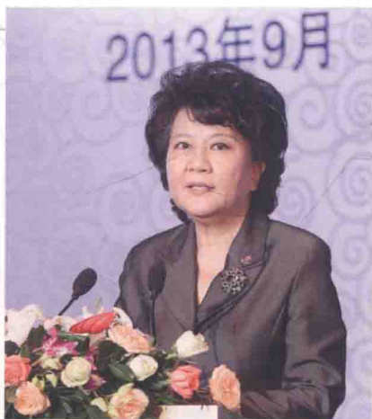
国务院侨务办公室主任裘援平在开幕式致辞