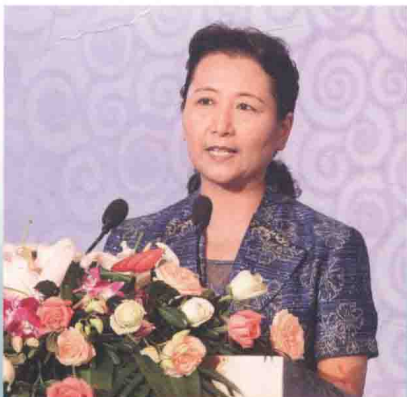
国务院新闻办公室副主任崔玉英在开幕式致辞