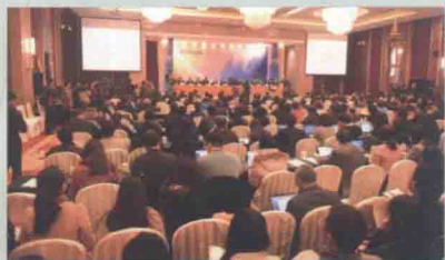
“新世纪丝绸之路经济论坛”大会现场