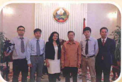
2014年4月，老挝副总理宋沙瓦·凌沙瓦在万象接受中新社记者采访。