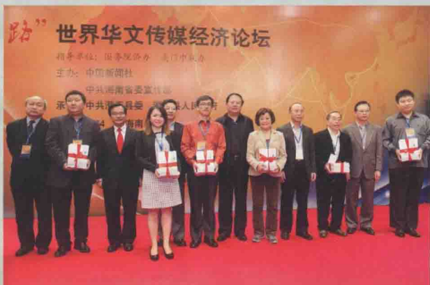
《丝路新语》新书首发式