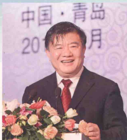
全国人大常委会副委员长陈竺出席开幕式并致辞