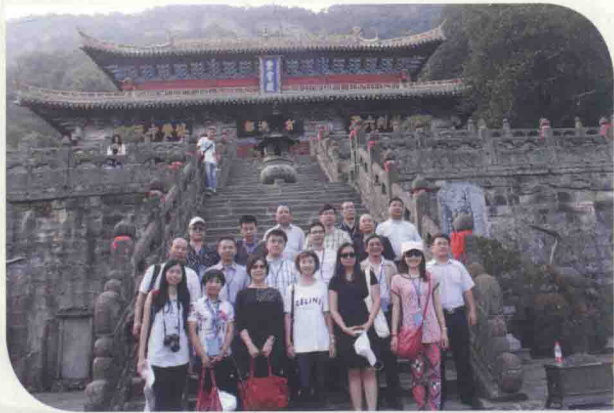
在武当山紫霄宫合影