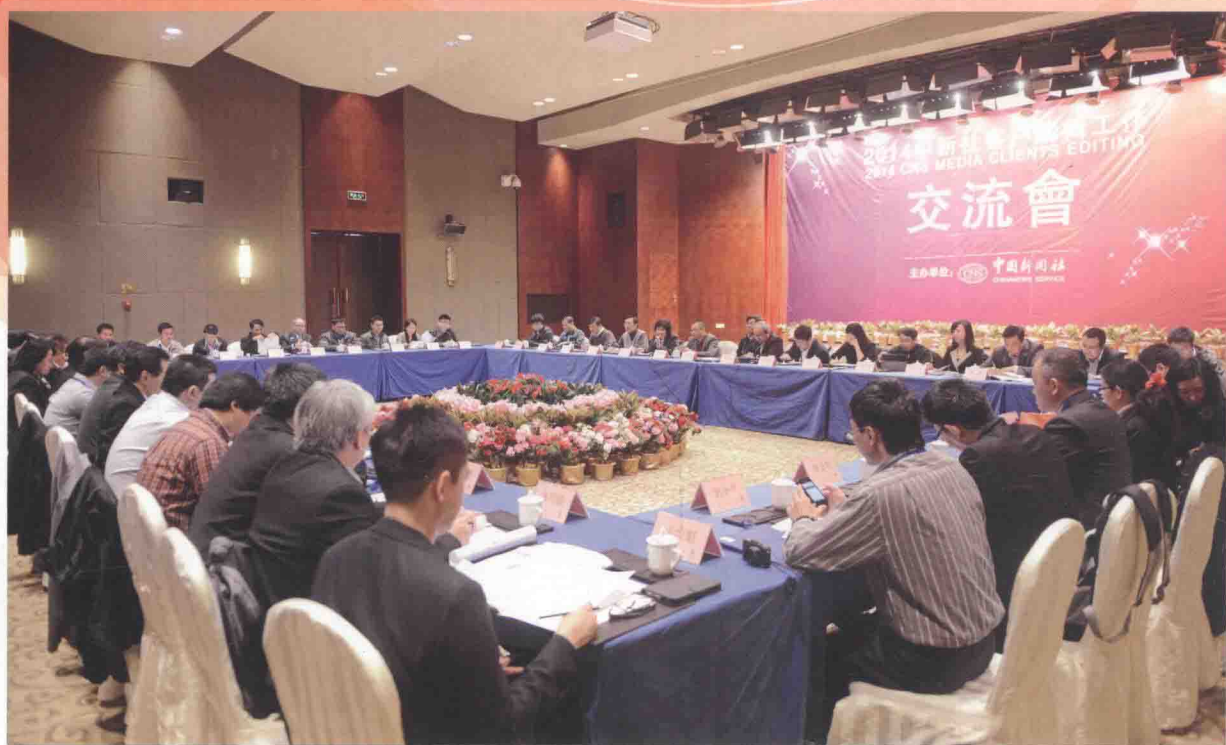
2014年2月22日，“2014中新社客户编辑工作交流会”在福建泉州举行。