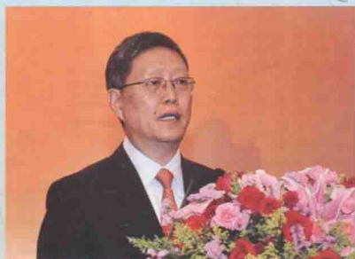
国务院侨办副主任何亚非发表讲话