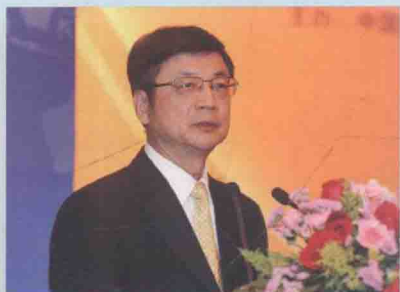
时任中国新闻社社长刘北宪致辞