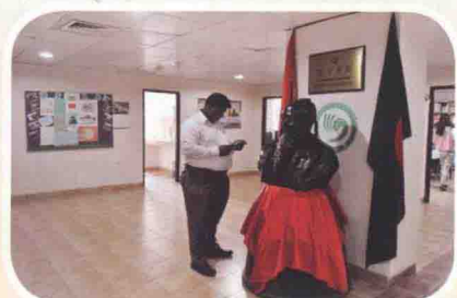
2014年5月12日，中新社记者在孟加拉国达卡采访孔子学院。