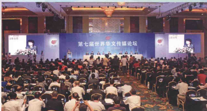
2013年9月7日至10日，由国务院侨务办公室、山东省政府、青岛市政府和中国新闻社共同主办的第七届世界华文传媒论坛在山东青岛举行。