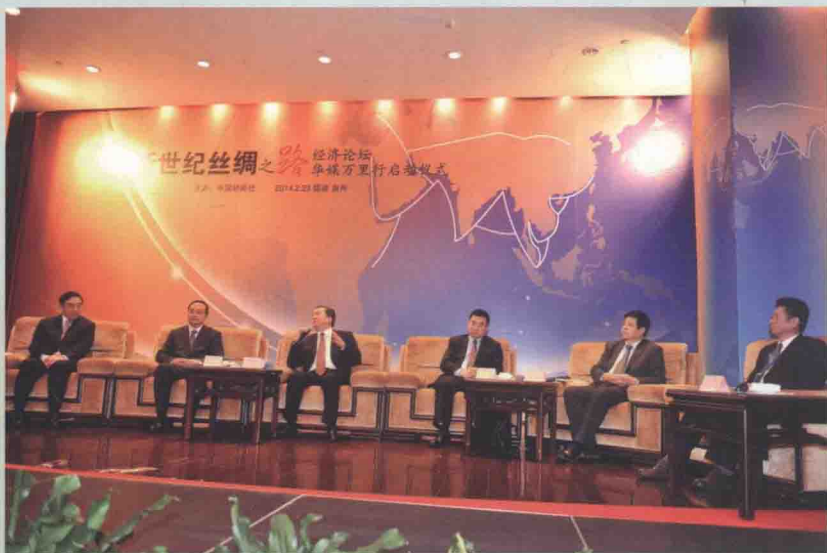
与会嘉宾围绕着“丝绸之路新商机在何处”等问题展开了探讨