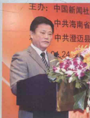
中共海南省委常委、宣传部部长许俊致辞