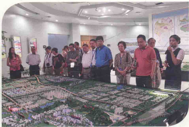
参观武汉光谷生物城