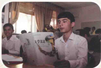
2014年7月，塔吉克斯坦国立民族大学大学生正在认真学习汉语。