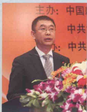
澳门中联办副主任姚坚致辞