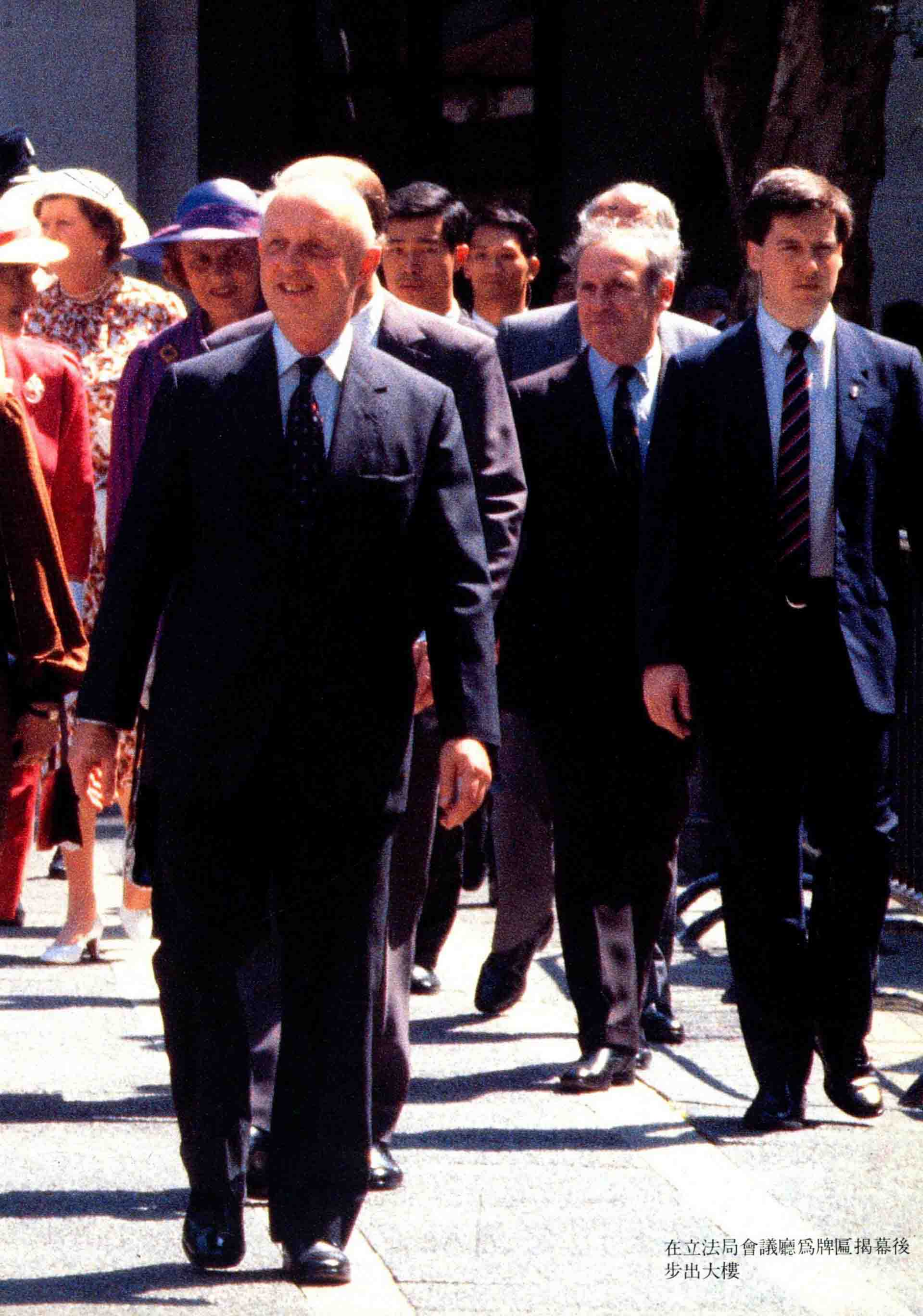
在立法局會議廳為牌匾揭幕後 步出大樓