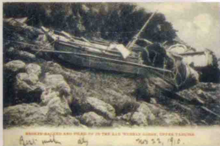
1910年实寄的三峡风景邮政明信片。