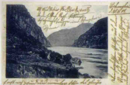
1907年实寄的三峡风景邮政明信片。