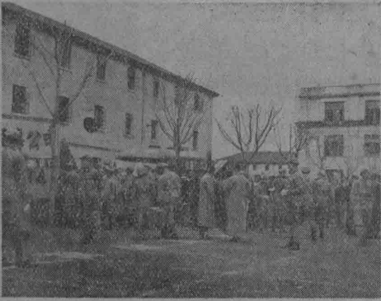
本校中學部訓練班赴蘇集訓中發出時情形(參看) (上)全班學生(下)準備車