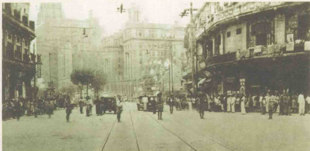
↑ 20世纪30年代上海租界街头

乱世中，各国在中国的租界成了许多人躲避战乱的去处。一些人也真“躲进小楼成一统，管它春夏与秋冬”，过起乱世中平静的日子。他们正是作者笔下那些“只要自己过得衣食饱暖，什么国家社会、什么公共福利，皆一概不管”的人。