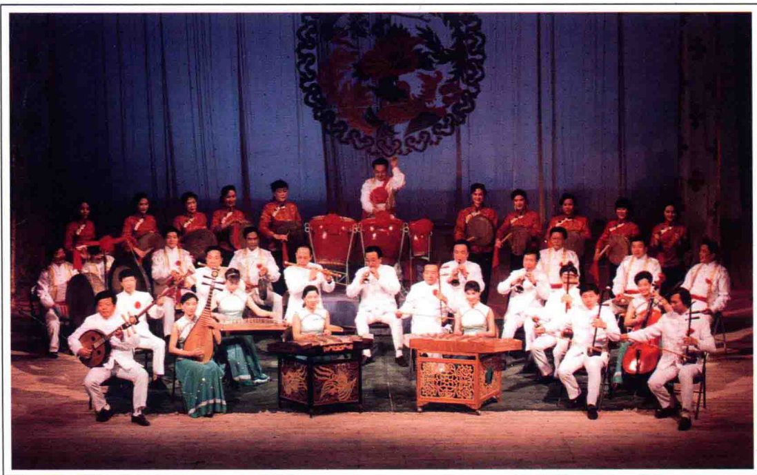
潮州大鑼鼓 《拋網捕魚》