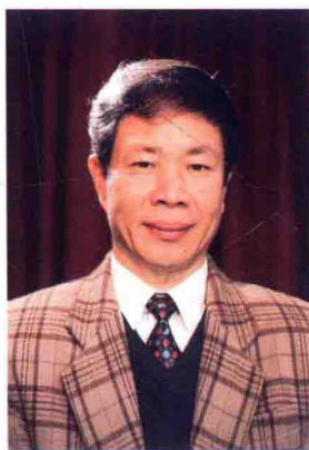
林吉衛：知名潮州樂演奏家，師從潮樂名師林玉波、何天佑，有頗高的藝術造詣。擅長二絃、竹絃演奏，風格典雅大度，剛柔相濟，尤以演奏「活五」調見長。曾多次應邀東南亞、西歐演奏和課徒，均載譽而歸。