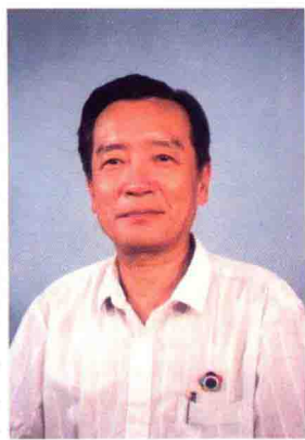
董峻：著名潮州樂演奏家。一九五七年第六屆世界青年聯歡節潮州大鑼鼓《拋網捕魚》演奏金質獎章得主之一。

董峻先生精工潮樂，二絃演奏藝術造詣高深，弓指嫻熟，音色柔美，聲情并茂，自成一格，多次出國演奏，美譽遠播。