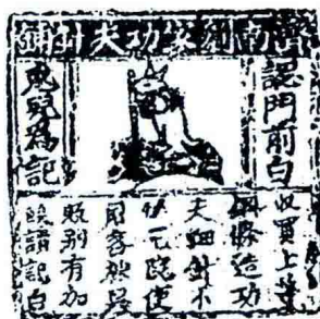
我国早期商标北宋“白兔儿为记”