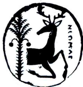
古希腊出土的古钱币图形