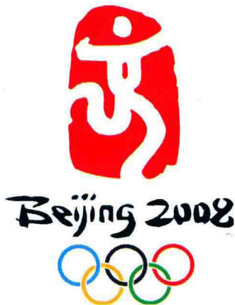
北京奥运会会徽——舞动的北京