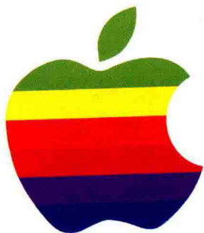
苹果电脑（美国） 苹果电脑，时尚生活，人见人“咬”。