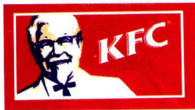
该形象是肯德基快餐的创始人山德士上校。老人和善亲切，笑迎四方宾客。