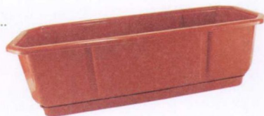
直径为 20~30 厘米的容器

中型容器一般指的是直径为 20~30 厘米的容器，长方形的中型容器长一般是 65 厘米左右。这种容器适合种植体型一般的花卉、香草，也可以种植菠菜、油菜等叶类蔬菜。