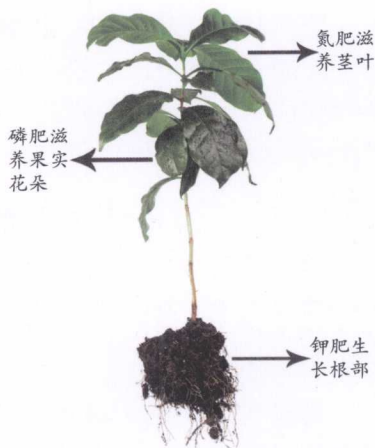
各种肥料对植物的不同作用

按照肥料的成分来划分，可以分为磷肥、氮肥、钾肥这三种肥料。磷肥主要是用来促进植物花朵和果实的生长，氮肥主要是用来促进植物叶子的生长，钾肥可以有效地滋养植物的根部。