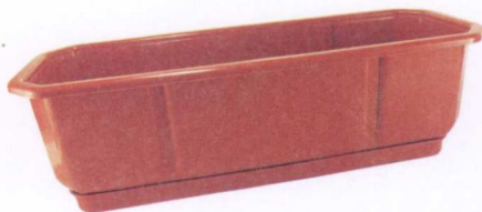
直径为 30~40 厘米的容器

大型容器一般指的是直径为 30~40 厘米的容器，西红柿、茄子等果实类蔬菜的体积较大，比较适合在这种容器中种植。