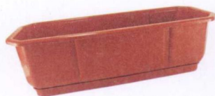
直径为 15~20 厘米的容器

小型的容器一般指的是直径为 15~20 厘米的容器，比较适合种植猫薄荷、百里香、细香葱、驱蚊草等植株体积很小的香草。