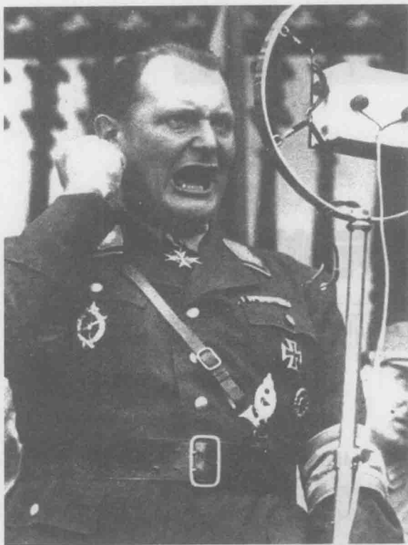
戈林是个狂热的纳粹分子，因为宣传纳粹口号的戈林