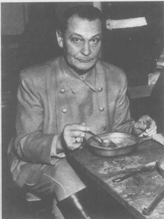
纽伦堡监狱中的戈林

此外，戈林还插手经济事务，他先后接管了石油和合成橡胶、外汇、军事物资等一系列的管理。在接管了众多部门之后，戈林开始实施一个庞大的经济计划，既复兴德国经济的“4年计划”。计划的第一部分是让德国的工业机器以最大的马力开动起来，达到自