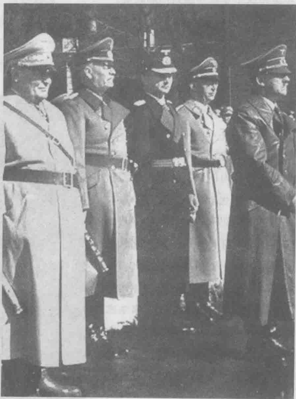
纳粹的头目们：左起依次为戈林、凯特尔、 邓尼茨、希姆莱、希特勒

戈林就是这么一个人，用惊人的能力制造罪恶，为了制造罪恶他不择手段，那么俗话说“多行不义必自毙”。用现在的一句话来说，枪毙他100次都不为过。