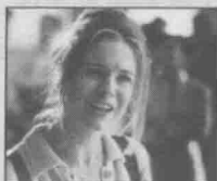
图4-15 特里·吉列姆在《指环王》中饰演阿拉贡。

眼睛在电影中扮演着重要的角色。在《指环王》中,演员的表演与角色的个性和生活密切相关。因此,在拍摄时,演员与导演的合作至关重要。了解了这一点,演员可以真正地投入到角色中。