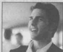
图4-16 杰瑞米·艾恩斯在《指环王》中饰演甘道夫。