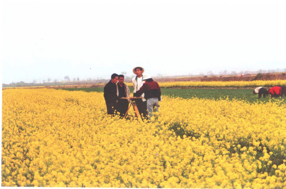
2. 2003年春季发掘人员在发掘现场布方