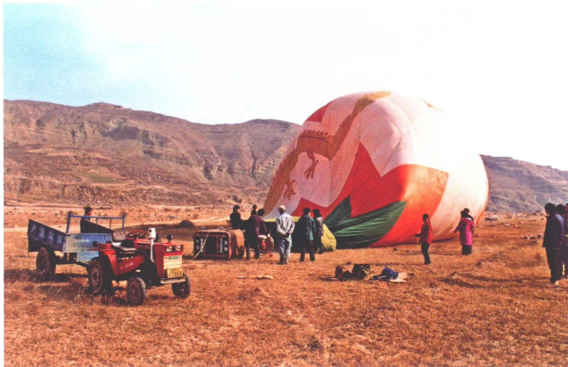
1. 1991年秋季热气球拍摄十字交叉长探沟