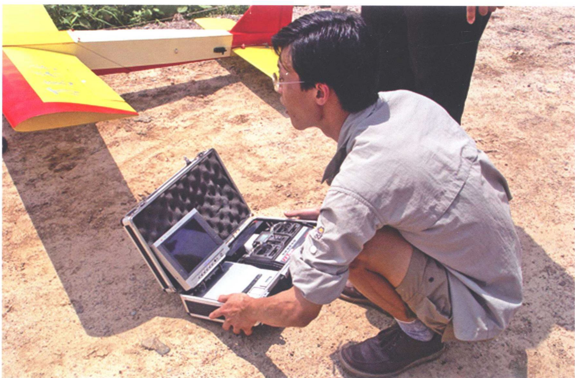
2. 2004年夏季航拍人员运用轻型遥控飞机拍摄城址全景