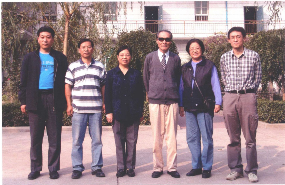
1. 2006年秋季北京大学严文明教授考察垣曲商城遗址