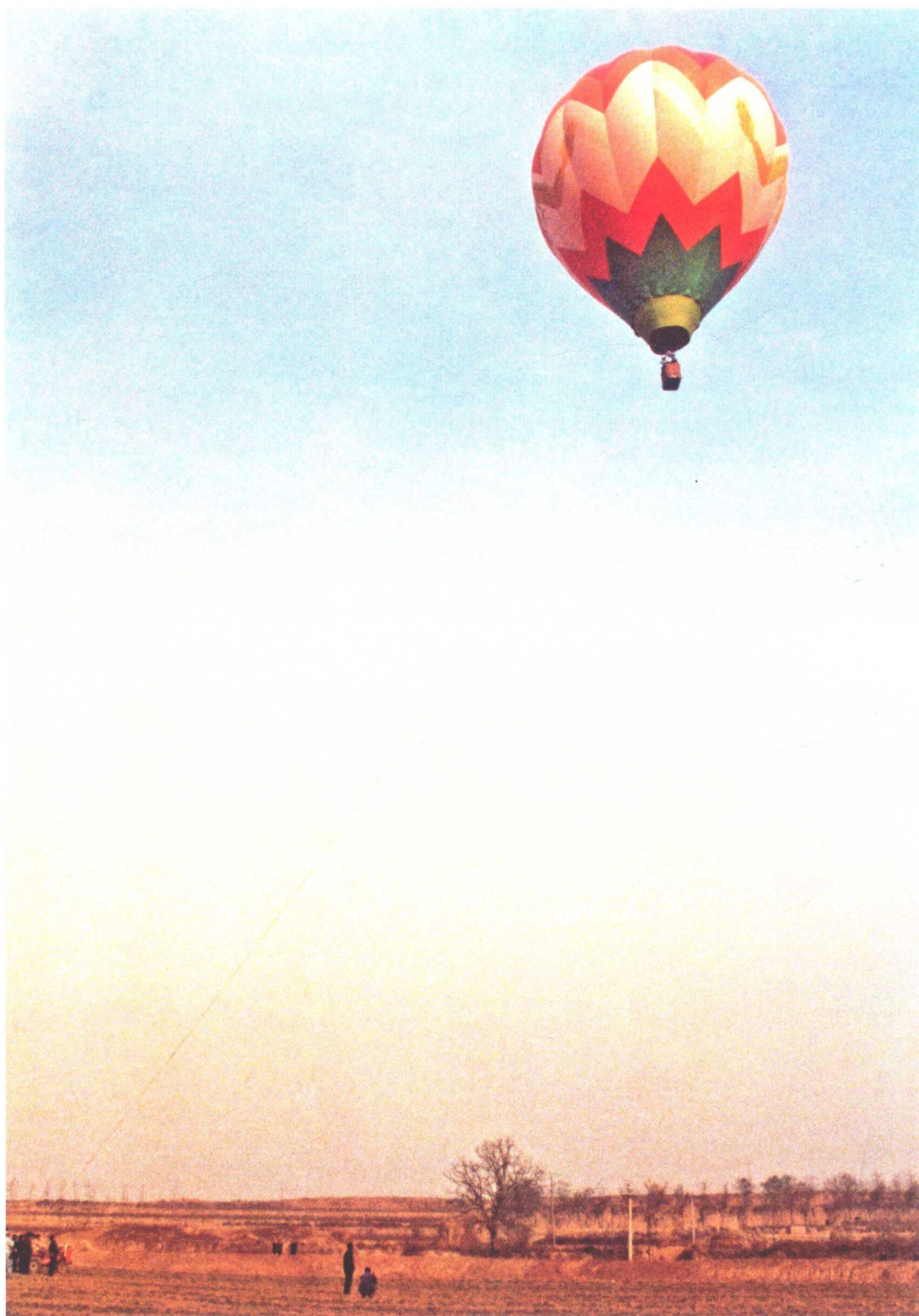
1991年秋季热气球升空拍摄商城西部地区