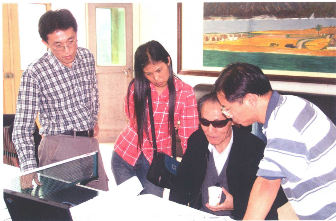
2. 2006年秋季北京大学严文明教授考察垣曲商城遗址