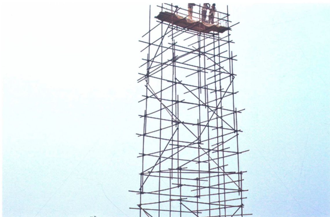
2. 2003年春季为了拍摄发掘区全景搭设的16米高摄影平台