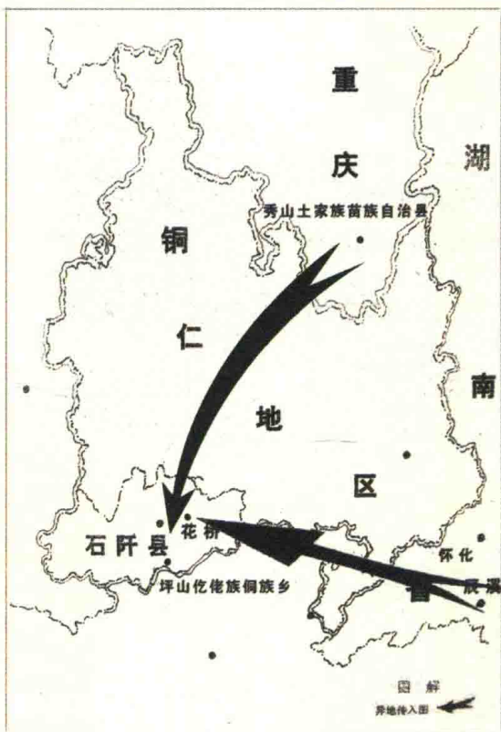
石阡木偶戏早期传播图