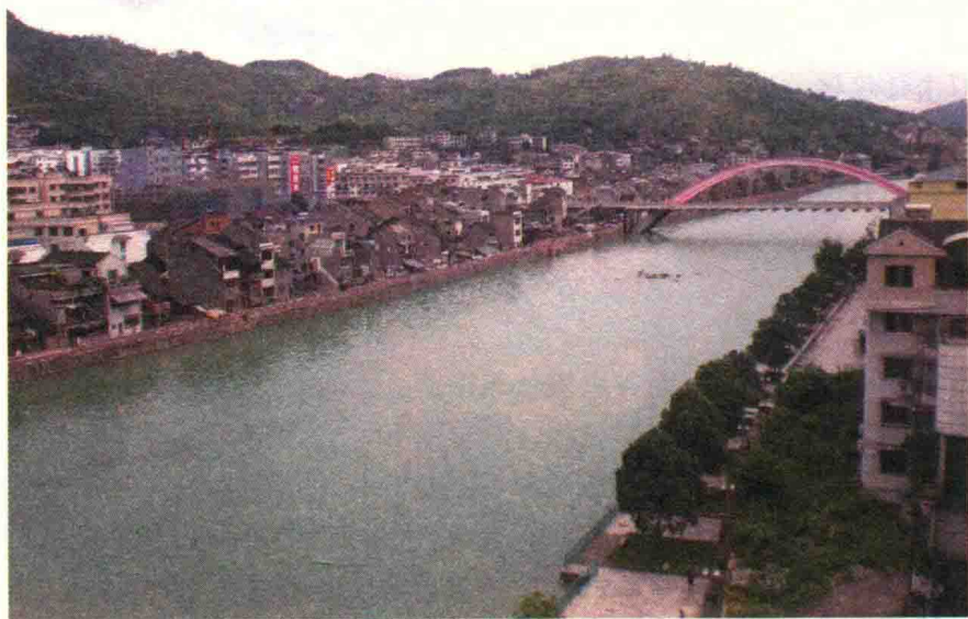
从石阡县城穿过的龙川河

阡人分别在乌江、石阡河（又称龙川河，古称龙底江）、余庆河等河岸凿开了27处渡口，加强了石阡与重庆酉阳、湖北宜昌、武汉乃至上海等城市之间的联系。本地的木材等土特产由此出山，外界由此把布、盐等货物带入的同时，也把川调、佛教、官学私塾带到了石阡。石阡与荆湘文化的联系主要依靠古代的陆路交通——驿道。1911年以前，石阡主要驿道有四条，分别通往