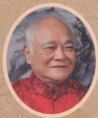
国医大师 李济仁 亲自主审