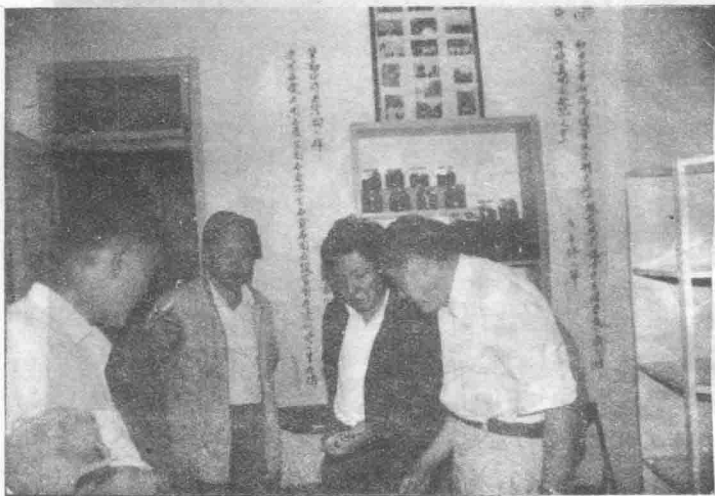
中共湖北省委第一书记关广富(右二)在姜祚正家中观石。