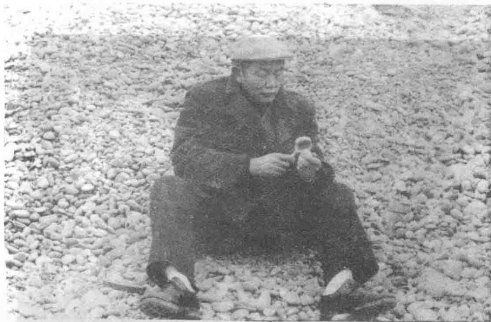
石海觅珍(作者近照)