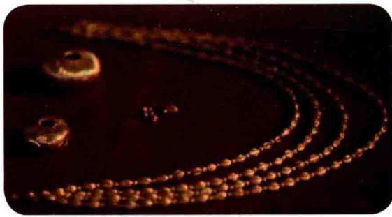
图0-3 保加利亚出土金饰

从实用转化为装饰是指有些服饰配件在原始的实用基础上发展为一种实用与装饰兼顾的配件。由于气候条件、劳动生活需要、卫生状况等因素，原始人将一些材料捆绑在身体的某些部位，形成了某种具有实用性、保护性的装束。渐渐地，人们不满足于单纯的实用性，而将这些装束越做越精美，形成了以实用为基础、以装饰为目的的双重合体。