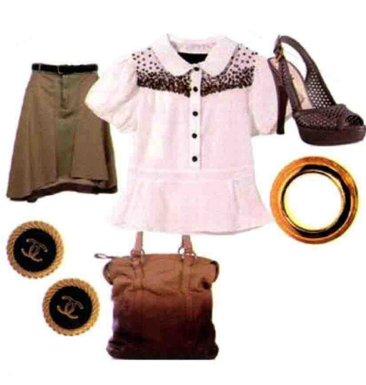
图0-4 服装与配饰搭配需根据穿着者喜好

现代服装讲求的主要是穿着者的舒适、美观，以及行动的方便等方面，而传统服饰的内涵与功能则要丰富得多。“天人合一”的思想是中国古代文化的精髓，是儒、道两大家都认可并采纳的哲学观，是中国传统文化最为深远的本质之源，这种观念产生了一个独特的设计