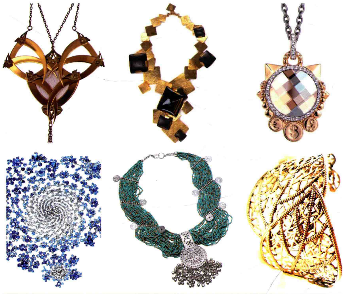
图1-1 服饰配件之首饰

服饰配件可分为实用性服饰配件和装饰性服饰配件两大类。目前市场上销售的普遍存在的服饰配件多为实用性的，如鞋、帽、袜、手套、腰带、箱包、围巾、眼镜等。他们主要具有实用功能，同时兼具装饰性，相对而言首饰类饰品多为装饰性，如项链、手镯、头花、胸针、耳环等。服饰品是实用性与装饰性结合的生活用品，与服装相比，更加突出其装饰性能，是以人体为基础的造型艺术（图1-1、图1-2）。