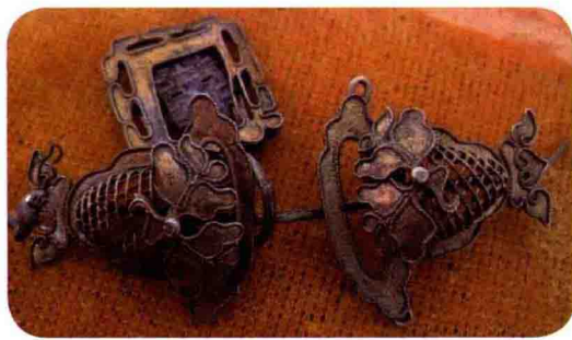
图0-2 出土鎏金首饰图