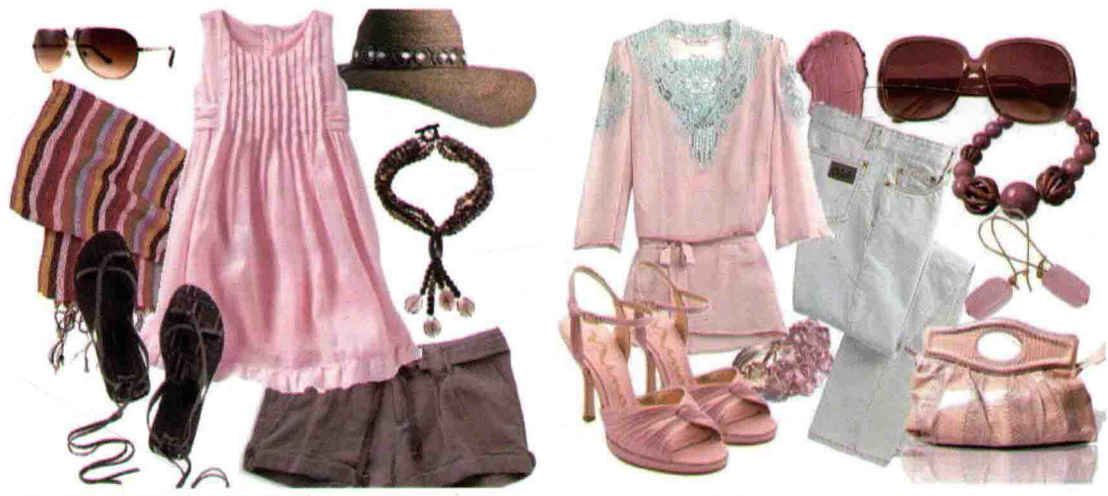
图0-5 服饰搭配需整体和谐

观，即把各种艺术品都看作是整个大自然的产物，从综合的、整体的观点去看待工艺品的设计，服饰亦不例外。这种设计观在我国最早的一部工艺学著作《考工记》中就已记载，《考工记》说：“天有时，地有气，材有美，工有巧，合此四者，然后可以为良。”早在两千多年前，中国工匠就已意识到，任何工艺设计的生产都不是孤立的人的行为，而是在自然界这个大系统中各方面条件综合作用的结果。天时乃季节气候条件，地气则指地理条件，材有美指工艺材料的性能条件，而工有巧则指制作工艺条件。对服装而言，则指服装的着装季节，着装环境及衣料的质地和剪裁手法，只有这四者和谐统一，才有精妙设计（图0-5）。