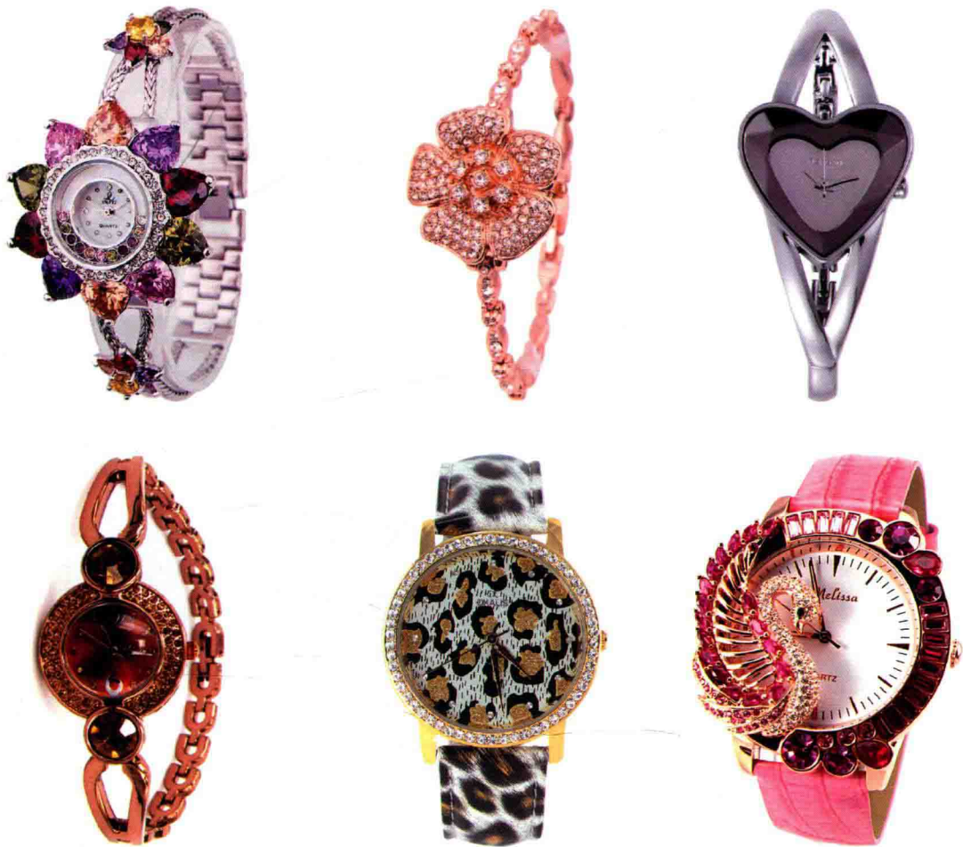
图1-2 与不同风格服装搭配的时装手表