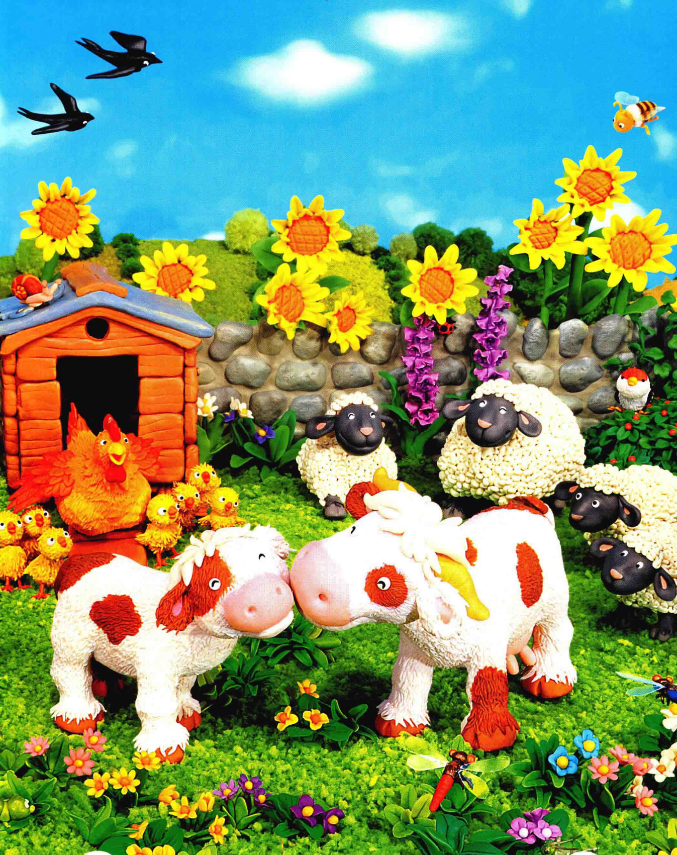
妈妈给了小牛一个深情的吻。 Mum gives Little Calf a loving kiss.