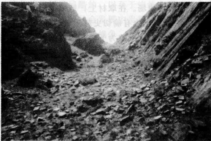
东周古雁门关遗址（代县西北分水岭）

从战争的双方看，中原诸侯对西北戎、狄游牧族的战争，发生在 10 处古战场上，有 11 次战事；中原诸侯之间的战争，发生在 49 处古战场上，有 76 次战事。两者所占的比例悬殊，说明先秦时期山西境内的战争，主要是中原诸侯之间的兼并战争。这种历史现象，反映了上古时期一方面在东方率先进入文明和发达的华夏族，开始了日益谋求从局部统一到大统一的进程；另一方面反映了逐水草游牧于北方的戎狄族，在无限空旷的草原上，人口尚极稀少，具有高度组织的强大的部落联盟还没有形成，对中原华夏族尚未构成真正的压力。