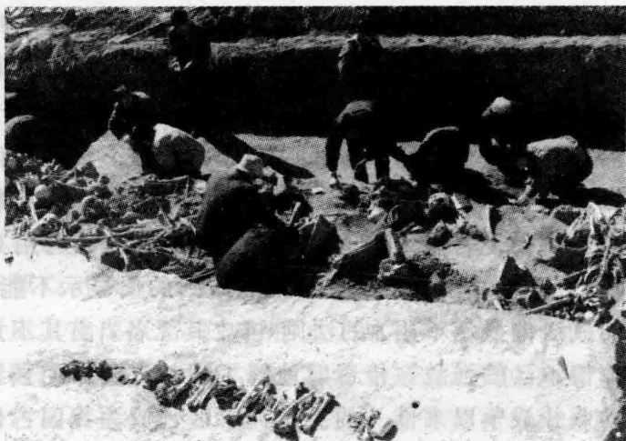
长平之战白起坑杀数十万赵俘发掘现场（高平北永禄）

秦赵长平之战 秦昭襄王四十五至四十七年（前 262～前 260 年），秦赵战于长平（今高平），历时 3 年，赵参