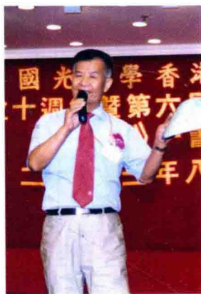
作者主持香港国光校友会成立十周年庆典