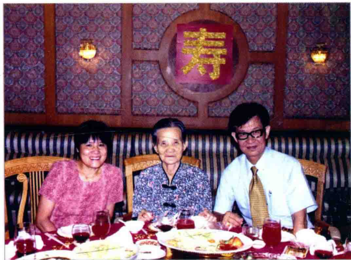
母亲（中）八秩寿庆时与作者夫妇合影