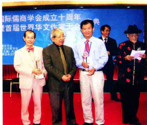
国际儒商学会顾问、前福建省省长胡平（左二）为作者（右二）颁发“儒商贡献奖”。（右一）为国际儒商学会会长潘亚暾，（左一）为方耀医生。