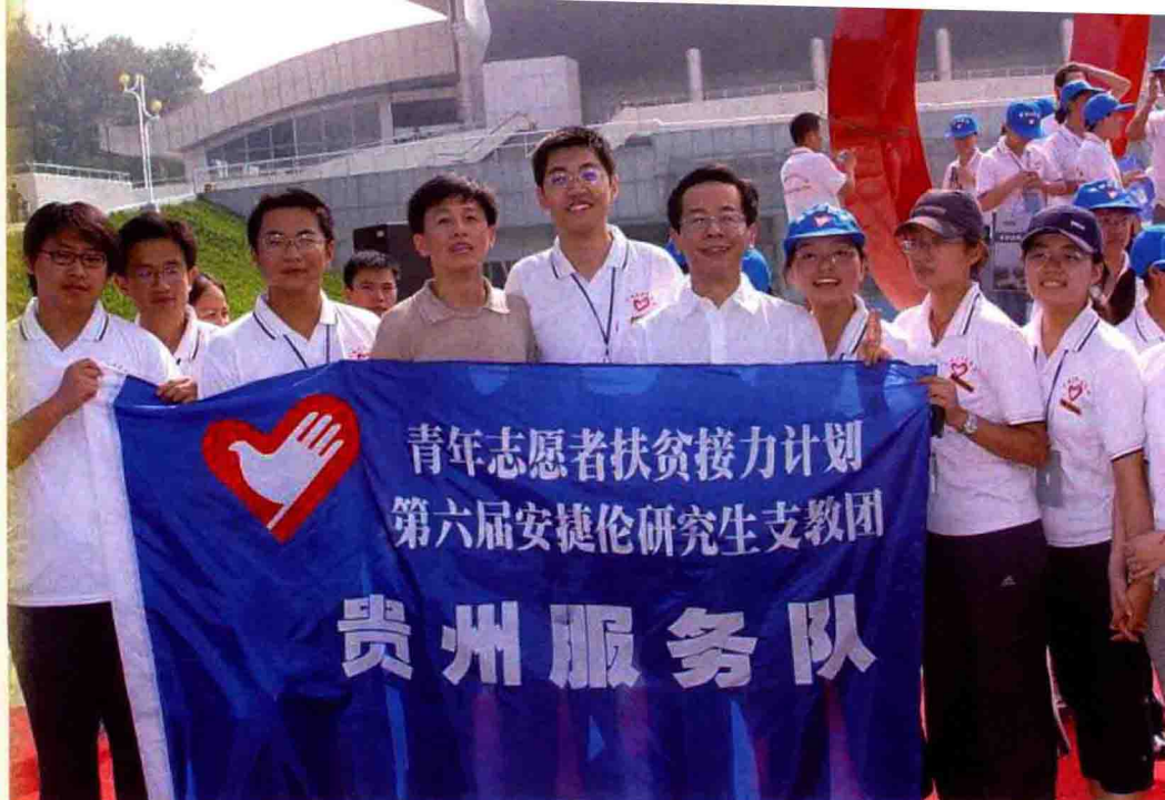
◆ 第三届研究生支教团成员