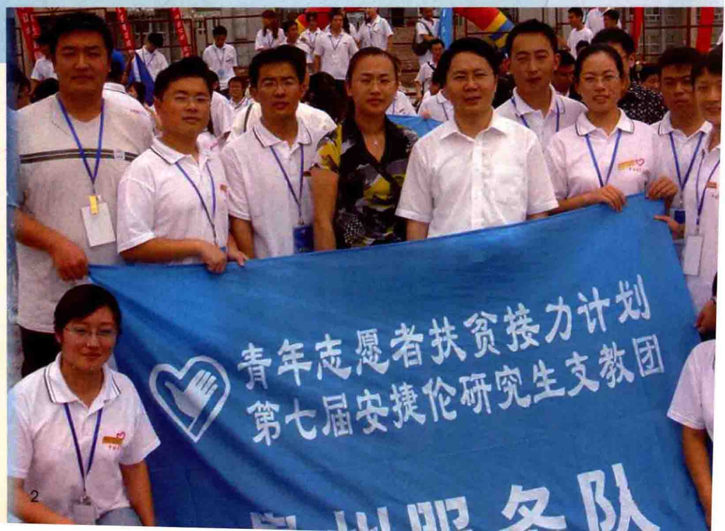
◆ 第四届研究生支教团成员