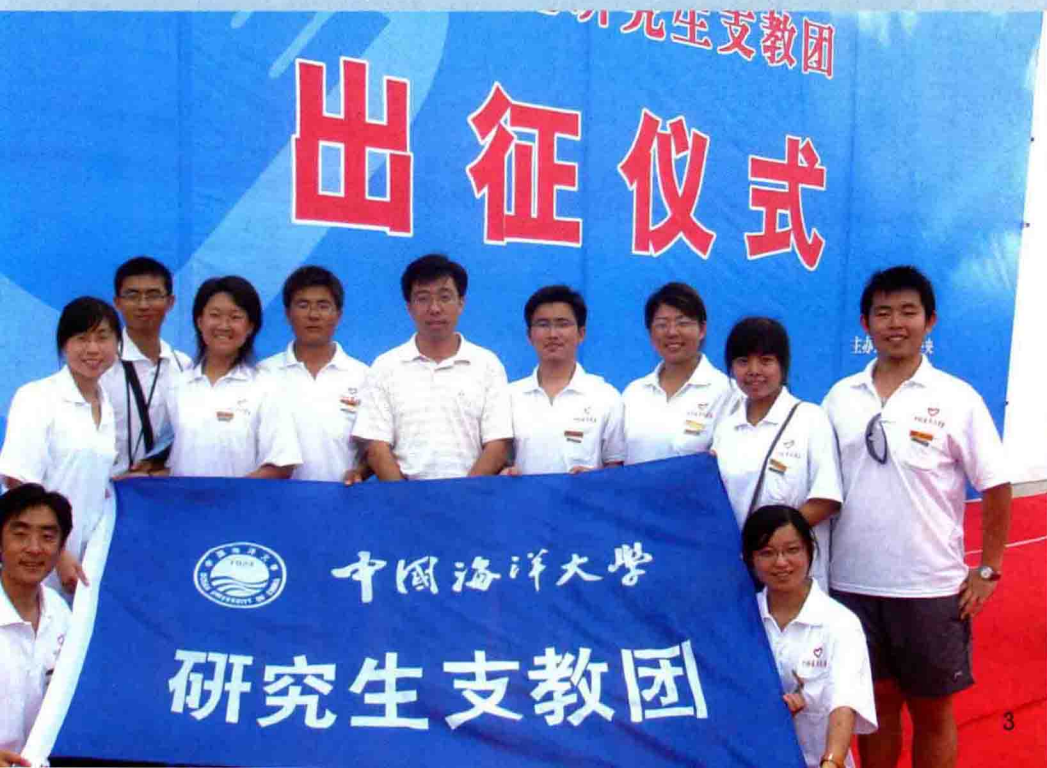
◆ 第六届研究生支教团成员