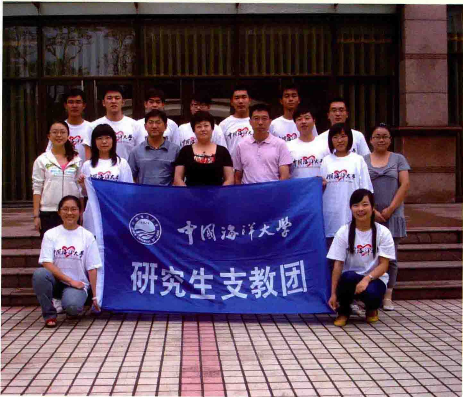
◆ 第九屆研究生支教團成員