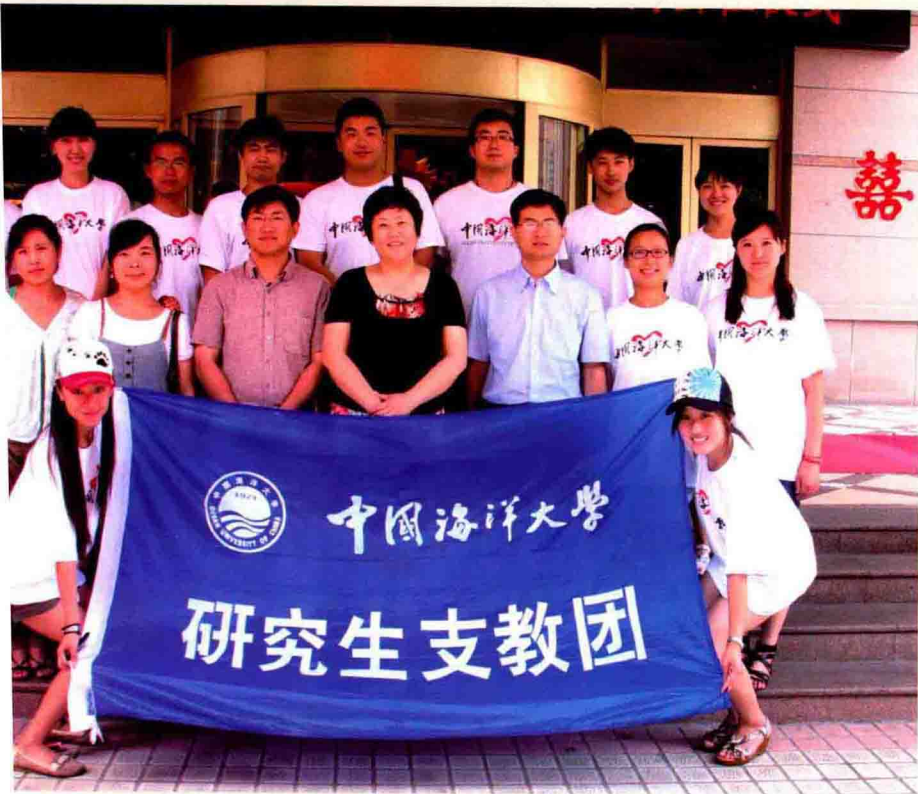
◆ 第十屆研究生支教團成員