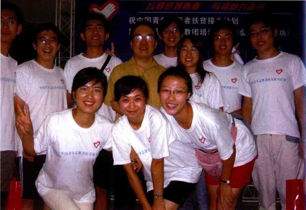
◆ 第五届研究生支教团成员