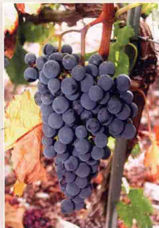
2 美乐