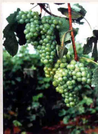
57 泉白