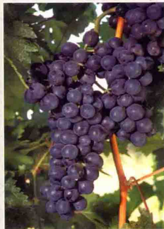
17 品乐