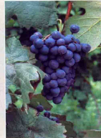
53 红汁露