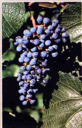
67 左山一