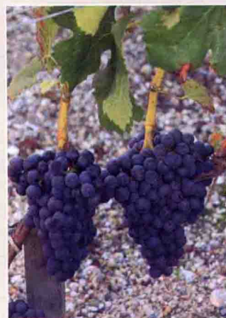
12 小味尔多