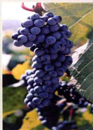
58 双丰 (吉林)