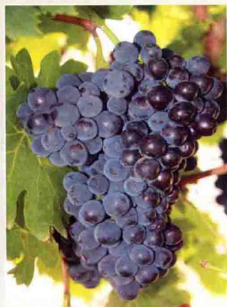
9 桑娇维塞