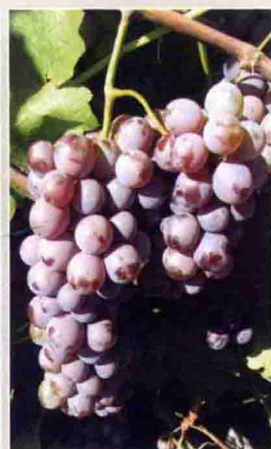
63 北全