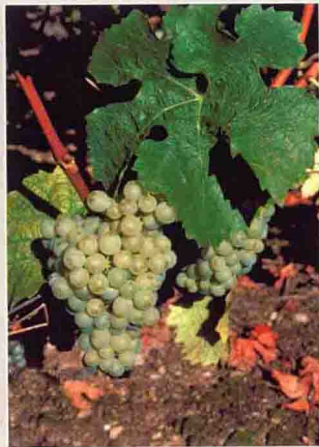
37-1 米勒