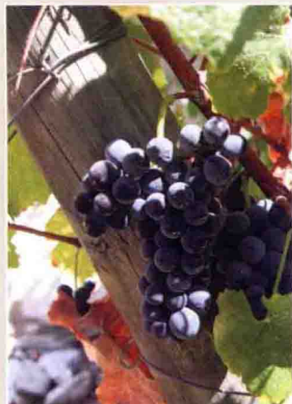
25 本土图丽佳