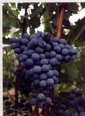
18 马瑟兰