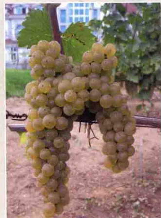
36-2 威代尔