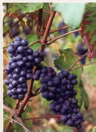
7 黑比诺