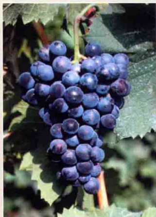
55 梅浓