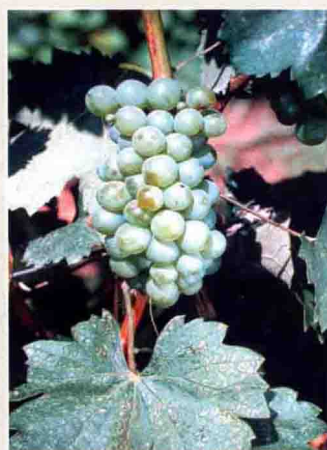
41 福明特