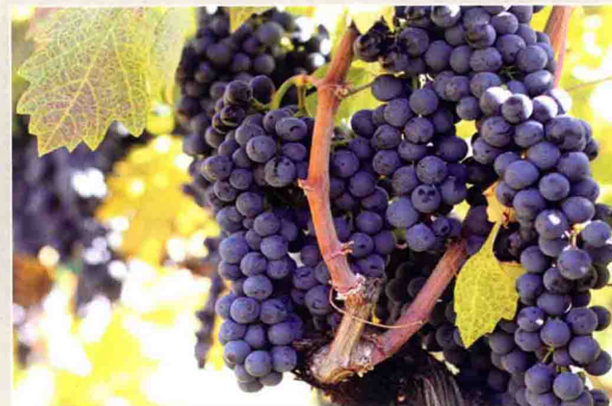
8 增芳德