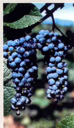
60 双庆 (吉林)