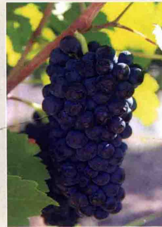
14 小西拉