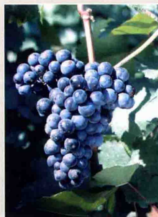
26 法国兰