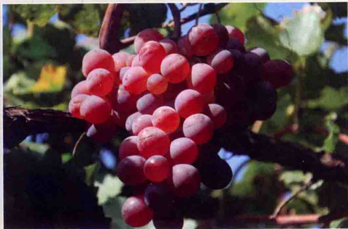
47 龙眼