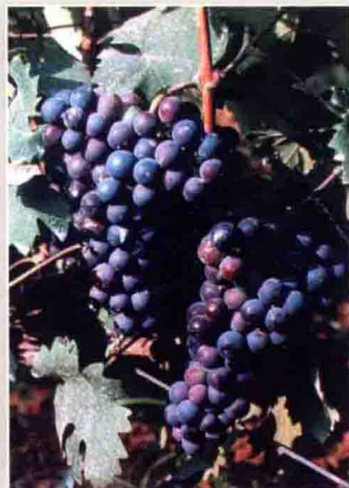
56 梅郁