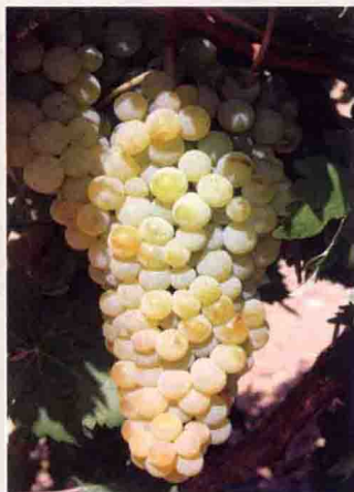
39 艾伦