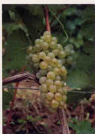
42 维奥妮