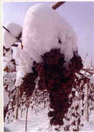
36-1 威代尔