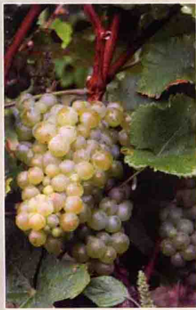
69 白福尔