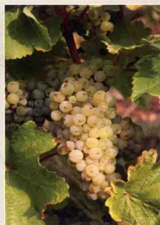
30 白诗南