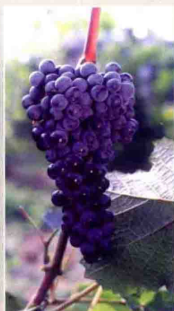
61 双优