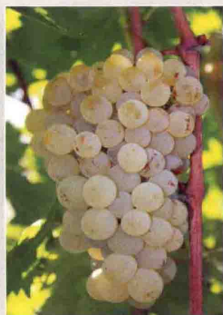
43 玛尔维萨