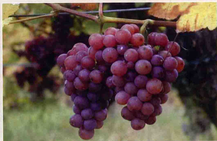
35 琼瑶浆 李德美摄