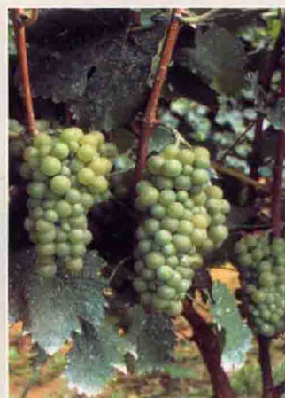
28 贵人香