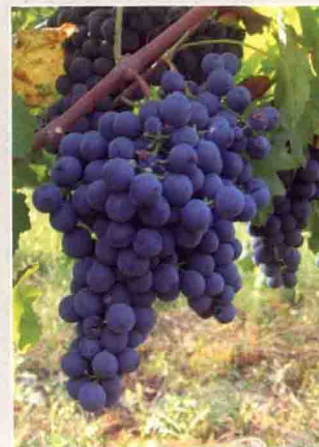
21 卡曼娜