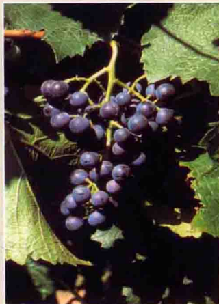
66 公酿一号