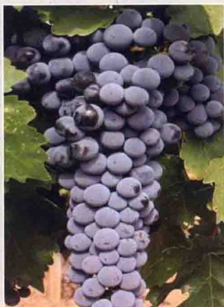
1 赤霞珠