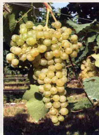
44 特雷拉