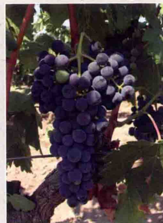
20 丹魄