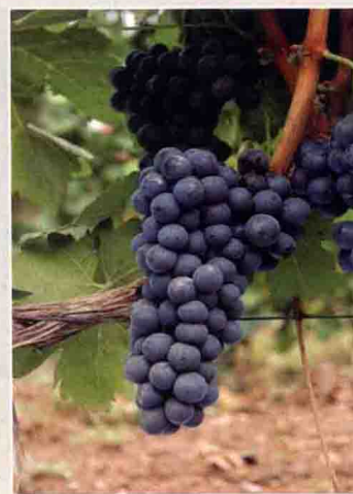
6 西拉