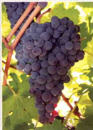
16 内比奥罗