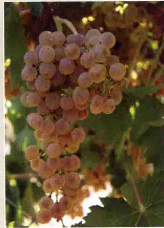
37-2 米勒