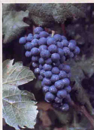
4 蛇龙珠