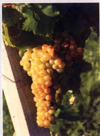
48-2 小白玫瑰