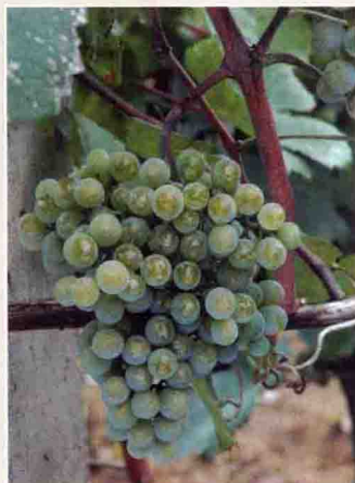
38 小芒森