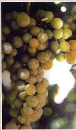
68 熊岳白 中国 葡萄志