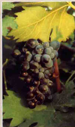
72 烟 73