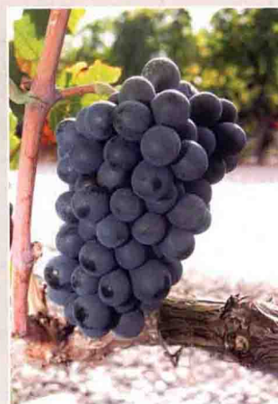
5 佳美