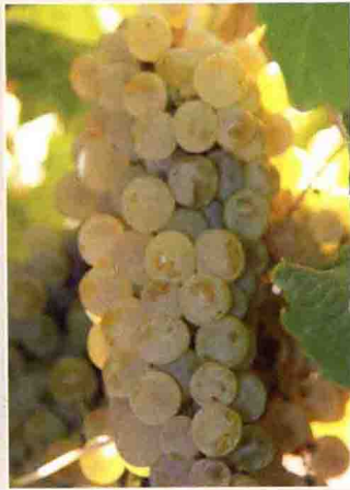
34 赛美蓉