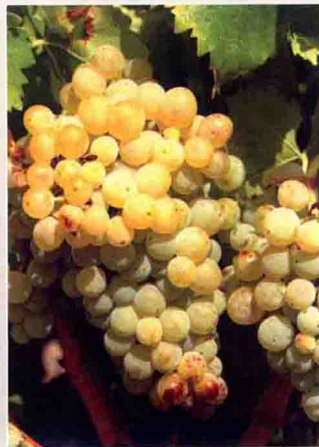
10-2 白歌海娜