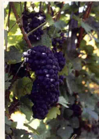
22 缪尼尔