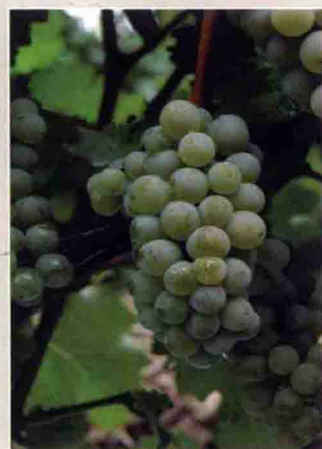
31 长相思