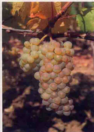
40 阿里高特