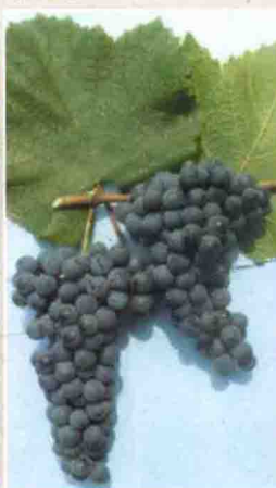
62 北红