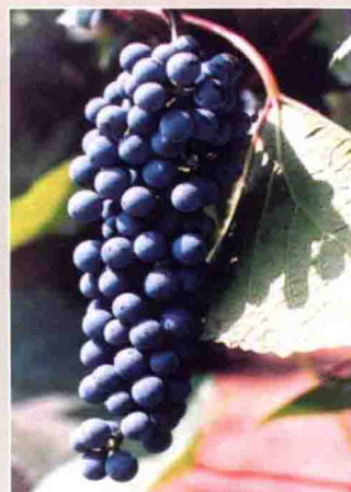
59 双红 (吉林)