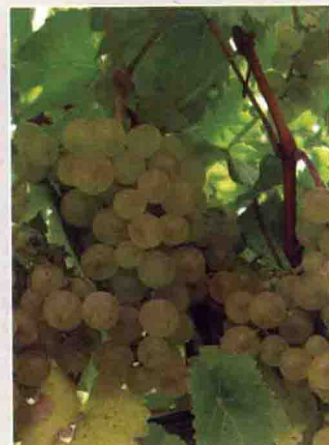
51 爱格丽