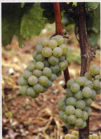
32 雷司令