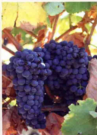
10-1 歌海娜