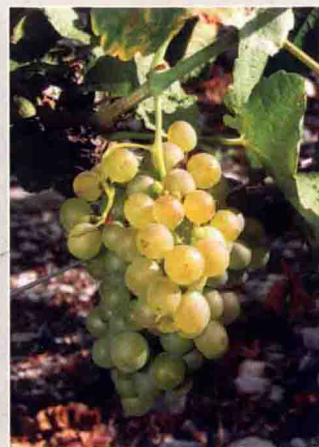
46 玛珊