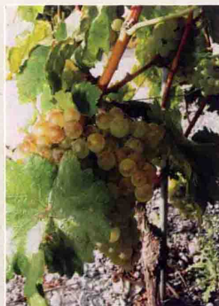
45 莎斯拉 李德美摄