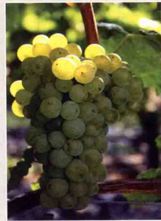
50 西万尼