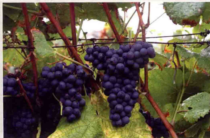
19 丹那