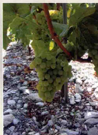
29 白比诺