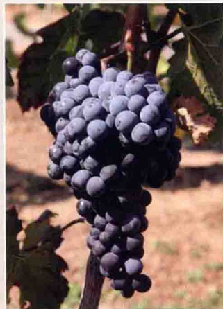
3 品丽珠