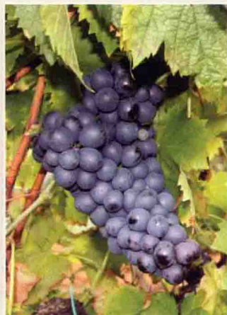
24 神索