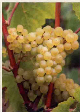
27 霞多丽