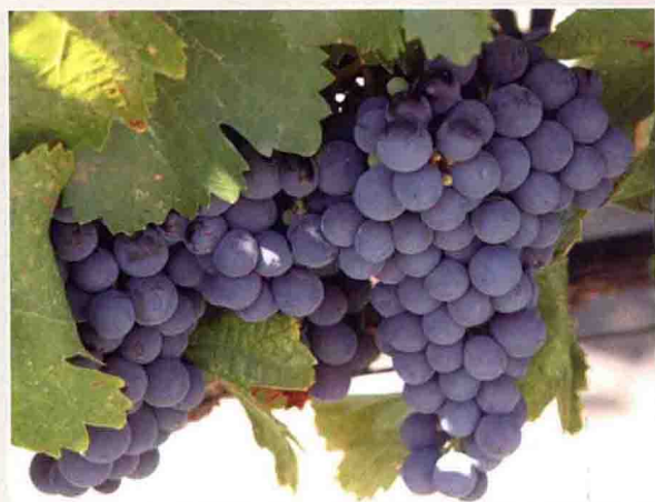
11 马尔贝克