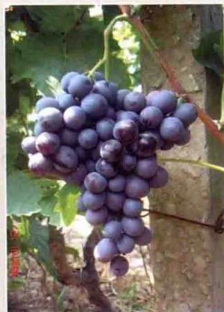
48-1 玫瑰香