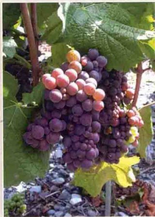
33 灰比诺