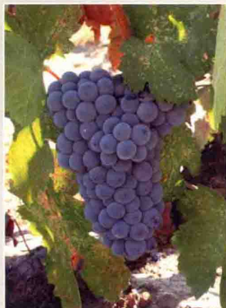
23 佳利酿