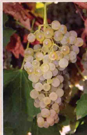
71 鸽笼白