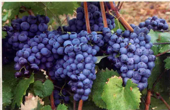
13 慕合怀特