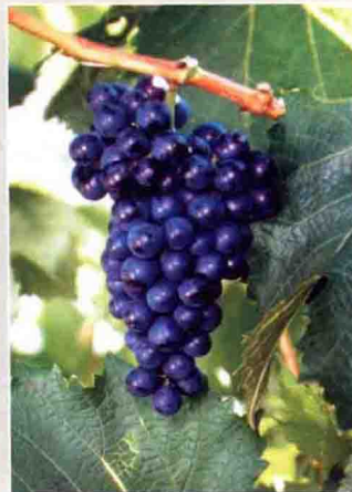
52 公酿二号