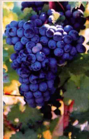
73 烟 74