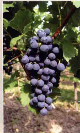
74 紫北塞 百度