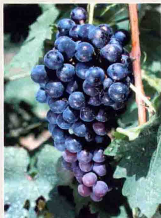
54 梅醇