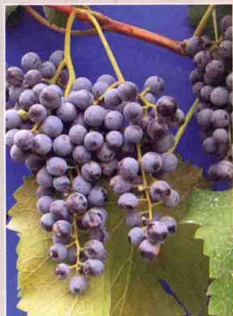
64 北醇