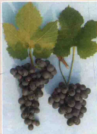
65 北玫