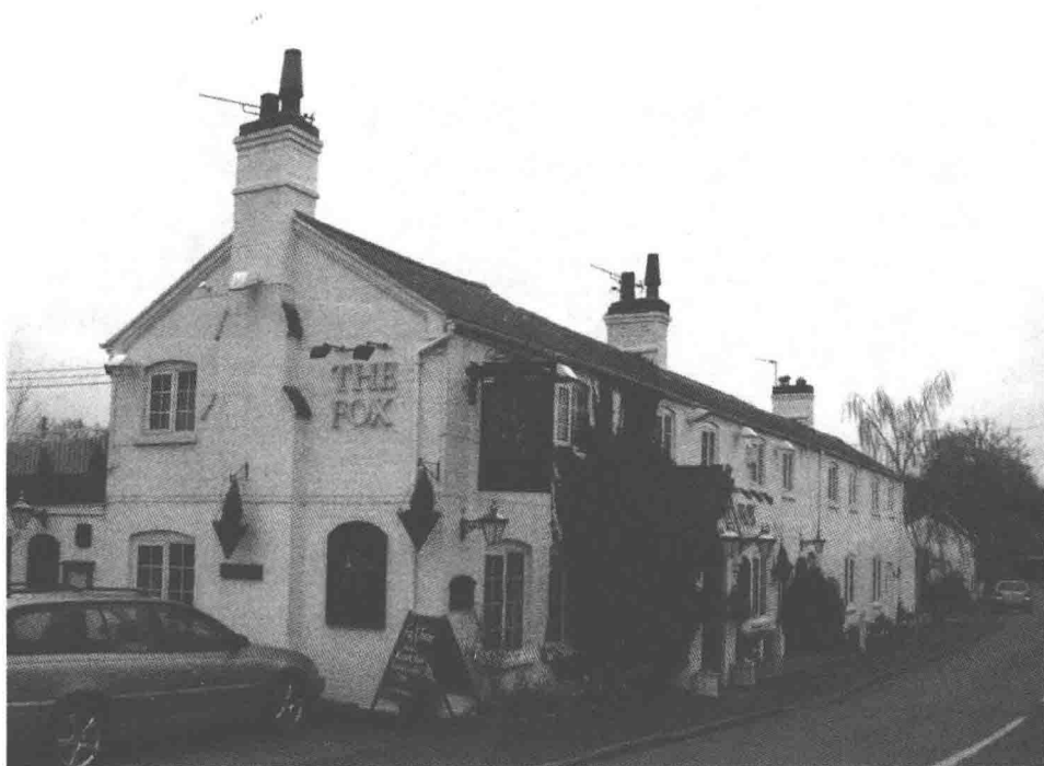
图 1.1 The Fox（乡村旅店或咖啡店），Loxley，Warwickshire