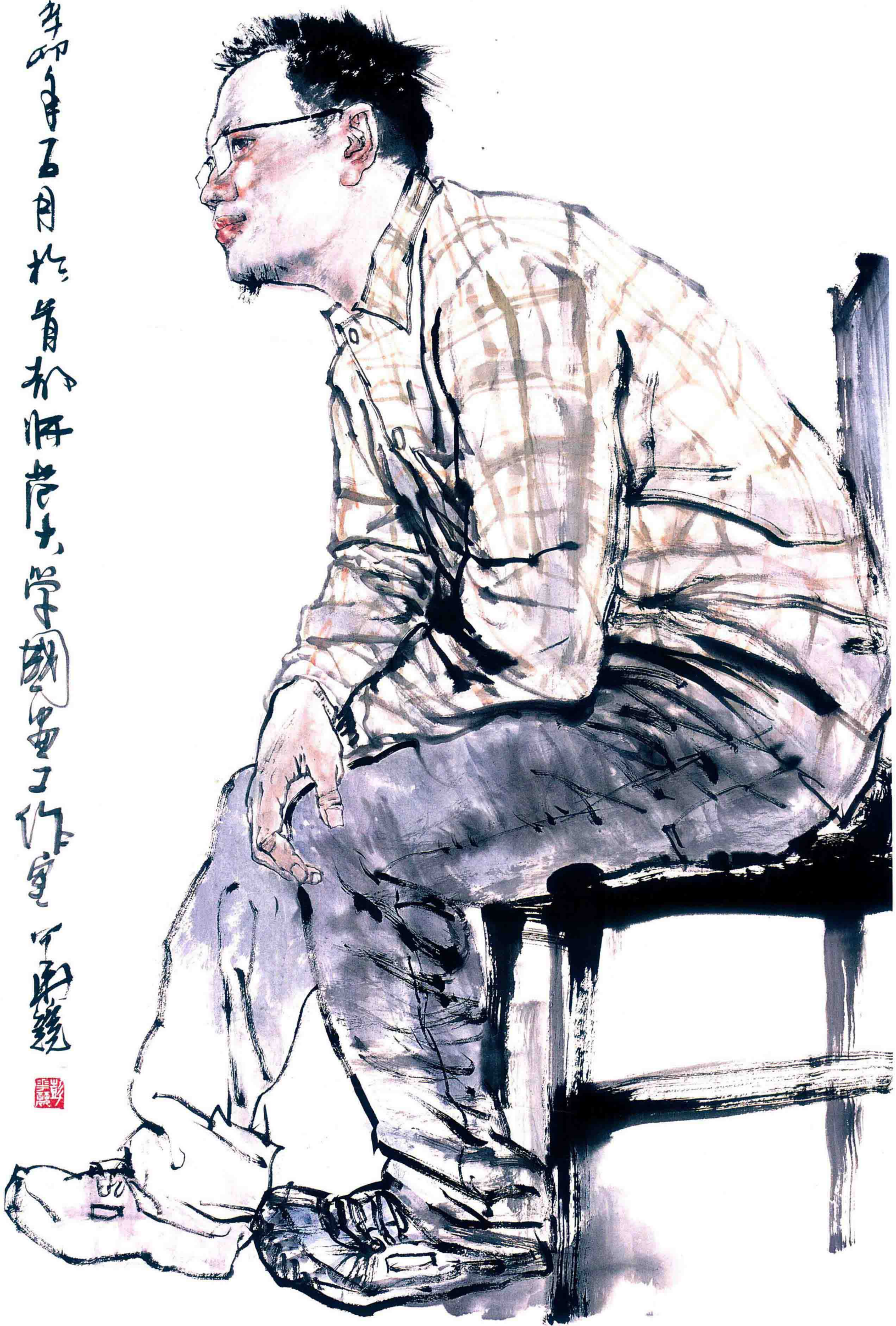
徐清 120cm X 68cm