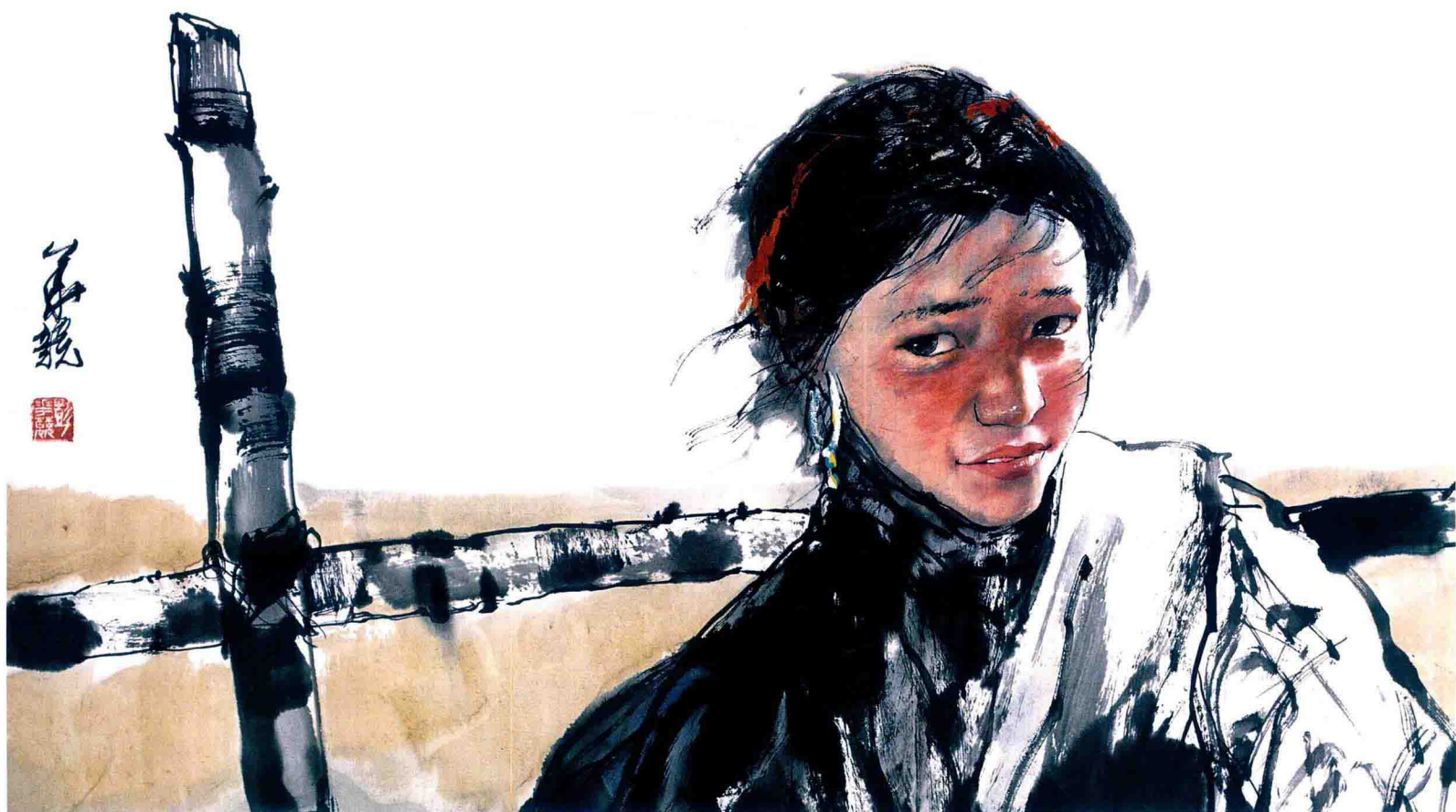
人物写生 45cm × 68cm