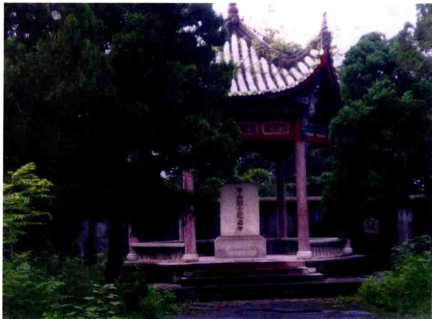
冯达飞等 20 位烈士殉难处及冯达飞等烈士纪念亭