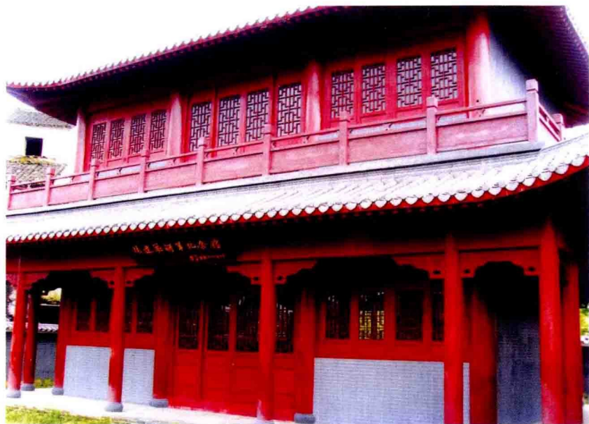
冯达飞将军纪念馆