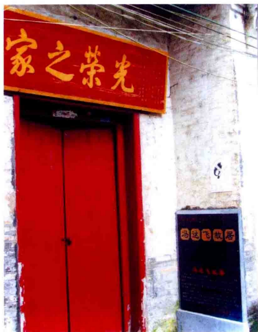
冯达飞故居,1950年被连县人民政府授予“光荣之家”,现为广东省重点文物保护单位。