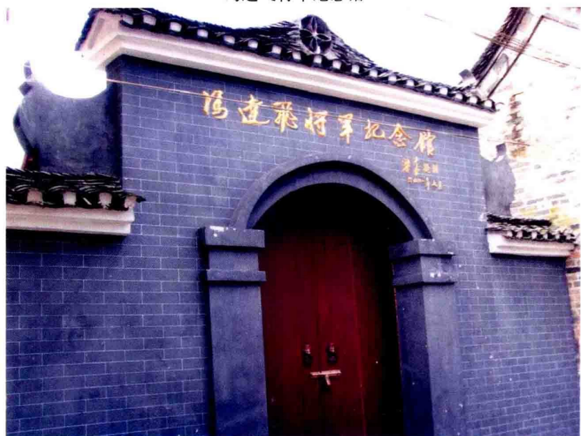
冯达飞将军纪念馆牌楼门口