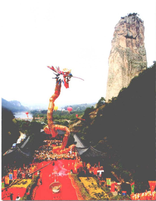
轩辕黄帝祭典现场瞰视

屹然干云，高二百丈，三面临水。周围一百六十丈；顶有湖生莲花，有岩相近名步虚，远而望之，低于步虚，近而视之，步虚居其下……古老云：黄帝炼丹于此。”可见轩辕黄帝在缙云仙都炼丹飞升的传说自古就远播江南各地，从而使缙云成为我国南方祭祀轩辕黄帝的重要场所。上古时期，江南臣民祭拜黄帝，都在仙都苍龙峡口的鼎湖峰下。东晋年间又在此建起了缙云堂。唐天宝七年（748年）唐明皇李隆基下旨敕改缙云山为“仙都山”，缙云堂为“黄帝祠宇”。时任缙云县令的著名书法家李阳冰亲撰“黄帝祠宇”石碑，一直保存至今。现存的黄帝宇祠是仙都风景名胜区最主要的人文景观，与陕西黄陵遥相呼应，号称“北陵南祠”，仙都也成为中国南方黄帝祭祀中心和黄帝文化辐射中心。缙云的黄帝文化经朝历代逐步扩大影响并深入人心，在风俗、宗教、饮食、建筑、农耕、山名、地名等方面影响着缙云人民社会生活的方方面面，形成了独具特色的缙云民俗文化。