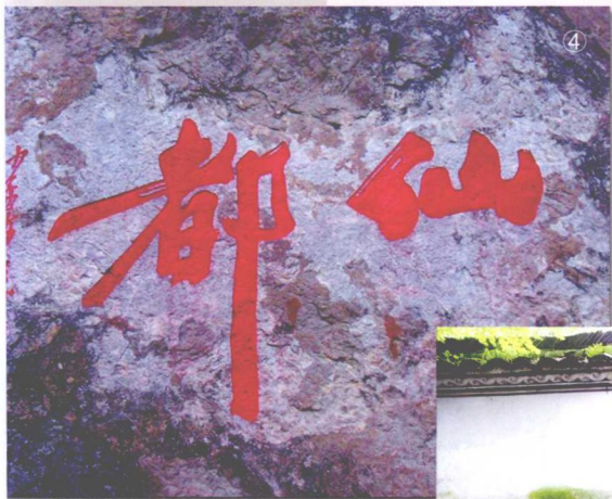
▲ ①②③④ 摩涯石刻