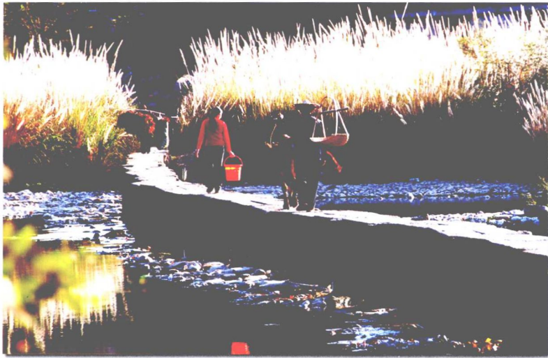
仙都鼎湖上的丁步桥

现为国家重点文保单位的仙都摩崖石刻群，有石刻120多处，是缙云宝贵的历史文化遗产，年代跨唐宋明清民国，书体有真草隶篆行，文体有诗词歌赋记，其种类之多、年代之丰、笔法之精，实为罕见。题记内容或记事或