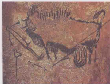
图1-1 法国拉斯科洞窟中出现的壁画

从古代的原始绘画中,我们的祖先创造了各种形象的符号,可以说原始宗教和巫术影响了史前图形艺术的发展。先民们在与自然的斗争中,获取食物、谋求生存的欲望在图形艺术创作中表现为对希望捕获动物的形象和与之相关的活动的描绘。法国南部拉斯科地区的山洞中发现的原始人壁画可以上溯到公元前15000~公元前10000年,绘画生动,但是没有特别的设计布局,绘画的元素基本上是简练的动物的形象,具有强烈的符号特征(图1-1)。岩洞的主厅因画有长5m的野牛而被称为牛厅,牛厅宽约8m,长约20m。洞内较高处的岩棚侧面画有各种颜色不同的动物,有牛、驯鹿、洞熊、狼和鸟,也有想象的动物和人像。画面大多是用简单几笔粗线条就准确勾画出动物的轮廓,在黑线轮廓内用红、黑、褐色渲染出动物的体积和重量,轮廓准确,神态逼真,显出跃动的生命活力和群体奔腾的气势(图1-2)。当时对于工具和材料的运用,也已达到相当高的水平。比如粉末颜料经过混合并与油脂调配后使用;有些粉末颜料是用骨管吹喷到岩面上去的,通过一些部位色彩的叠加增强了平面图像的面积感。拉斯科洞窟的壁画或排列或重叠或穿