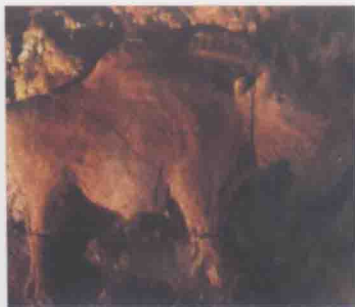
图1-3 法国阿列日发现的黏土浮雕 《野牛》

插, 显示出创作者具有初步的构图意识, 体现了史前图形艺术独特的审美意蕴。北美洲的印第安人岩画当中, 可以看到更加简练、更富于标志化的形象。