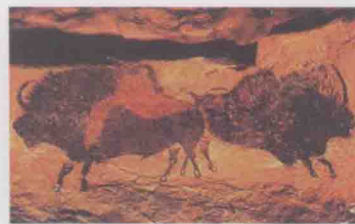
图1-2 法国拉斯科洞窟的壁画《公牛》