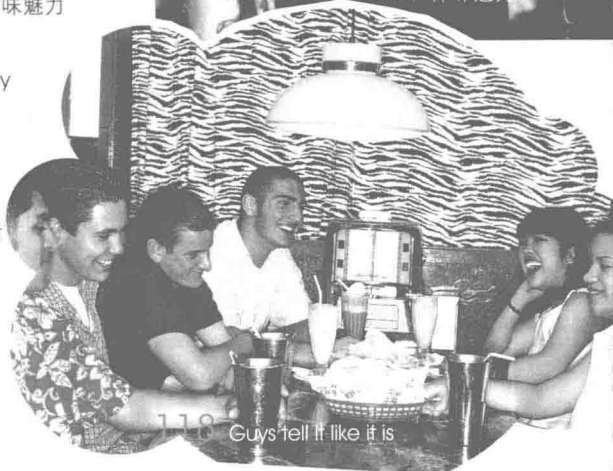
Guys tell it like it is