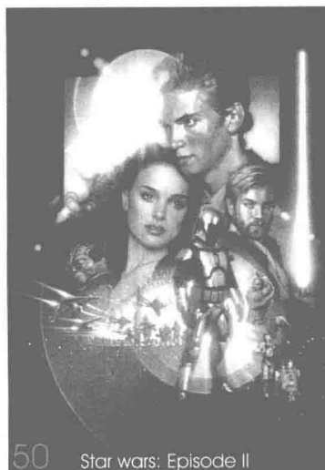
Star wars: Episode II