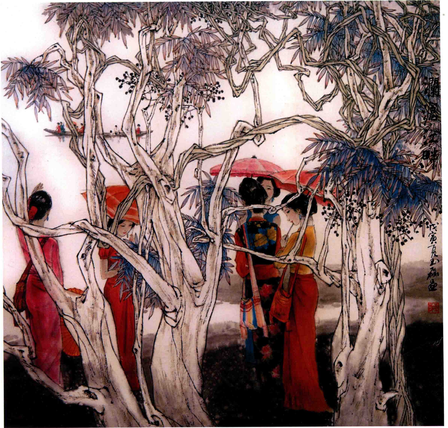
澜沧江畔 / 1998年 / 纸本 / 68cm × 68cm