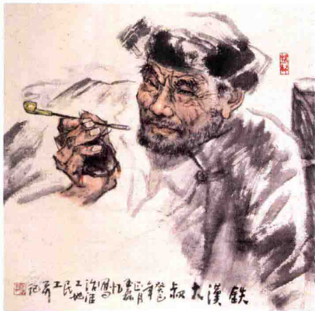
铁汉大叔 / 2013年 / 纸本 / 68cm × 68cm