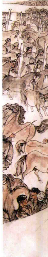
春雷初动 (局部) / 1984年 / 纸本