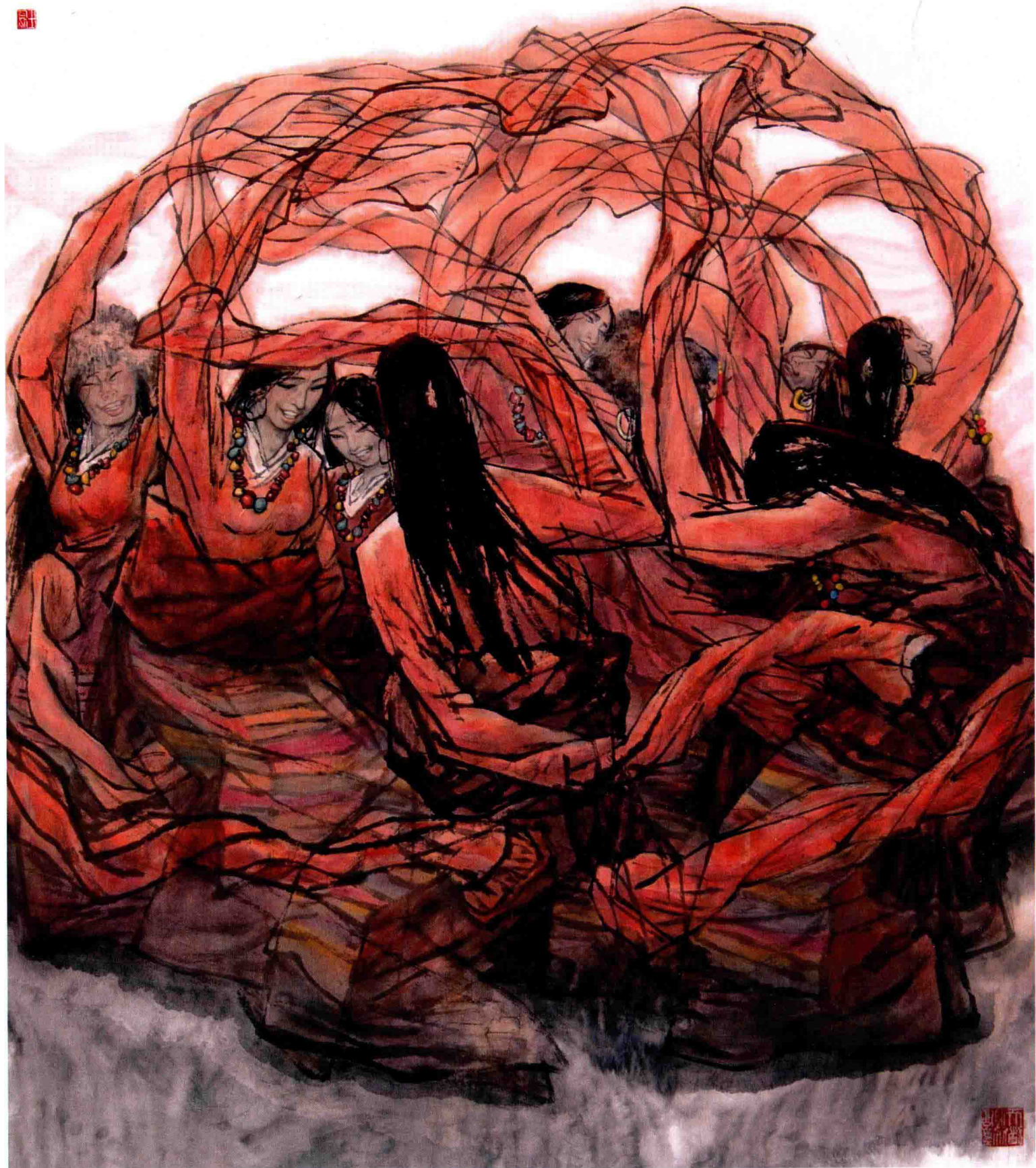
翻身歌谣 / 2001年 / 纸本 / 157cm × 96cm