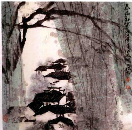
春雨初霁 / 2002年 / 纸本 / 68cm × 68cm