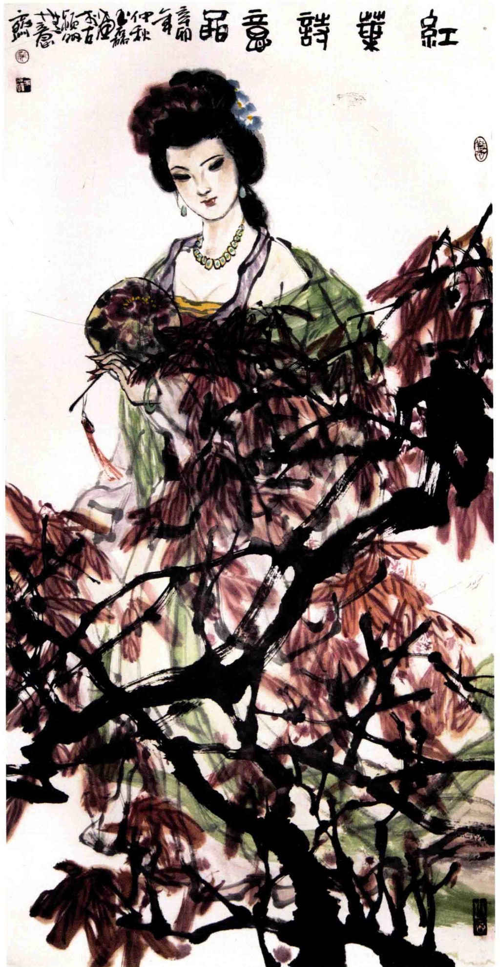
红叶诗意图 / 2011年 / 纸本 / 136cm × 68cm