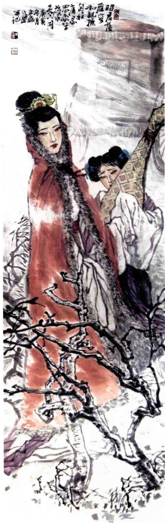
四美图条屏 / 2012年 / 纸本 / 180cm x 48cm x 4