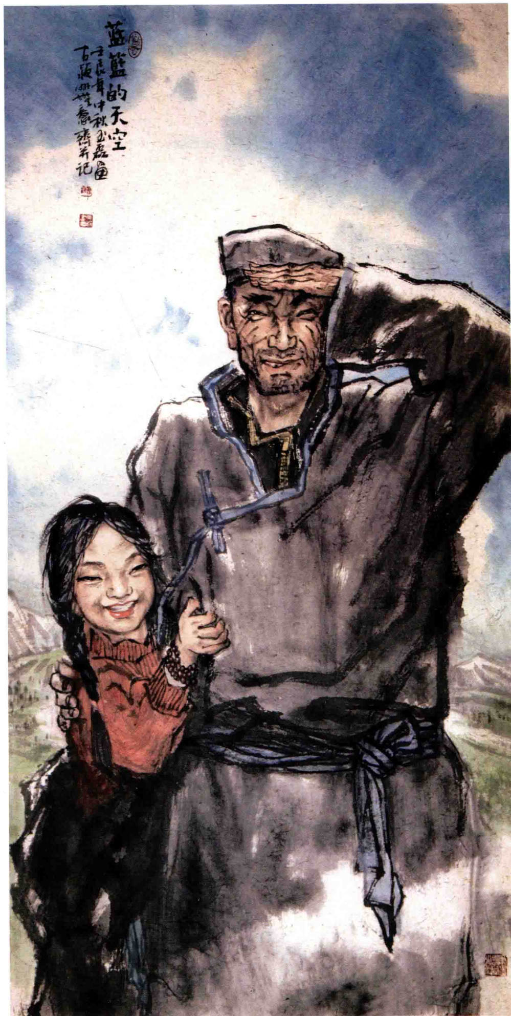
蓝蓝的天空 / 2012年 / 纸本 / 136cm × 68cm