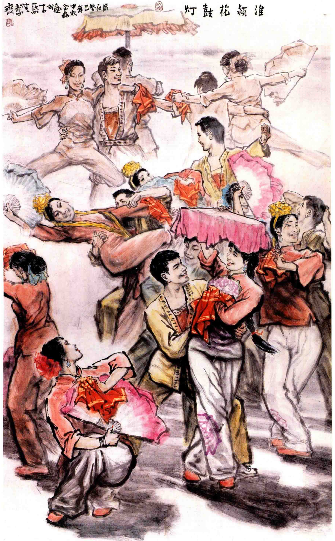
淮颖花鼓灯 / 2013年 / 纸本 / 200cm × 124cm