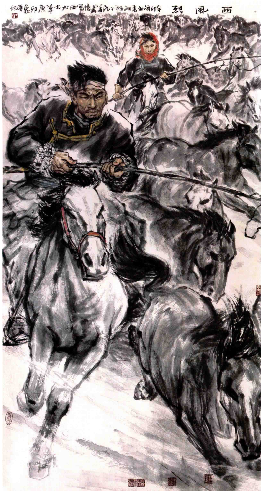
西风烈 / 2011年 / 纸本 / 180cm × 96cm