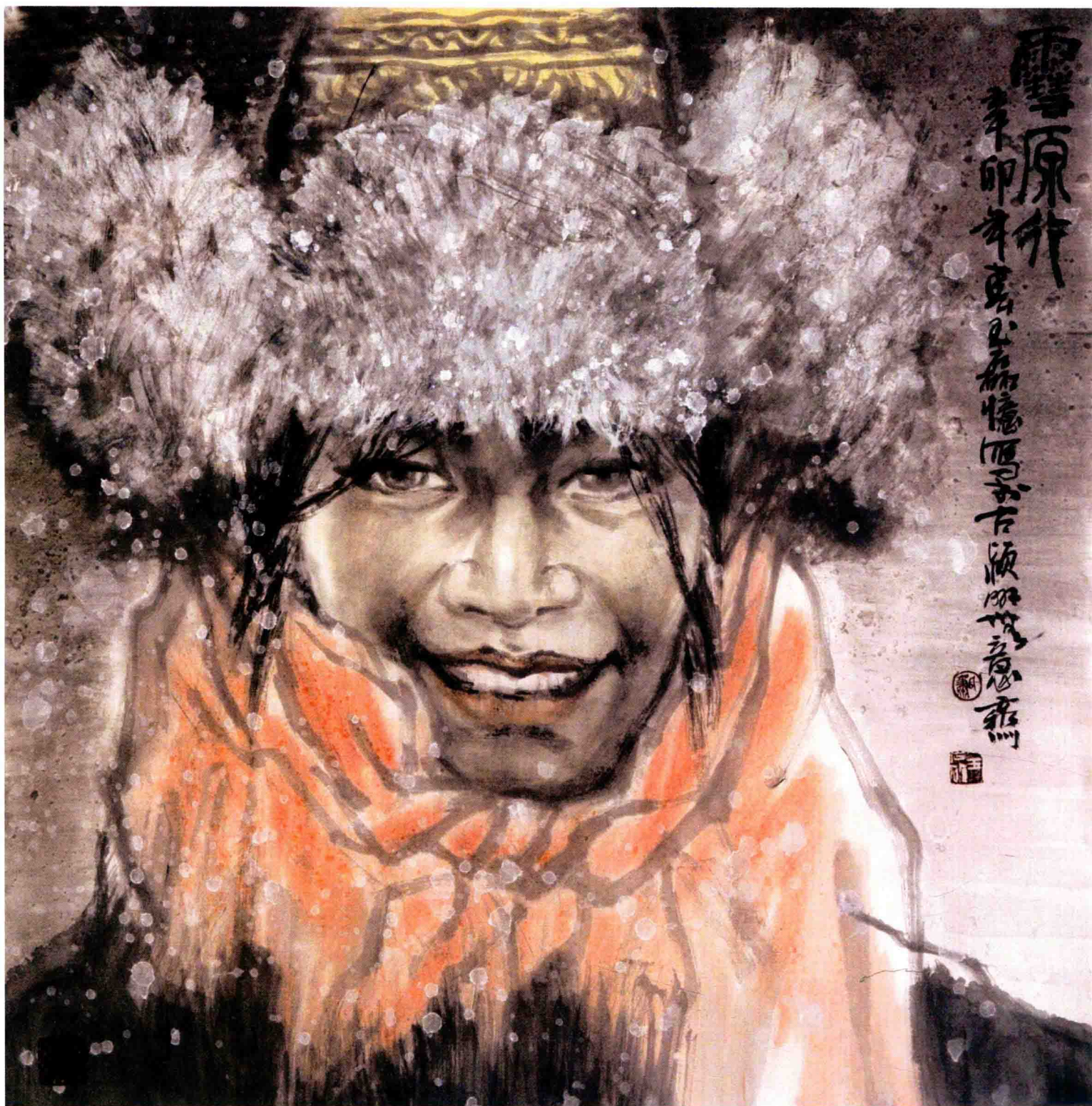
雪原行 / 2011年 / 纸本 / 68cm × 68cm