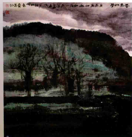
春色如梦 / 2000年 / 纸本 / 68cm × 68cm

时下画坛，不少人难耐寂寞，而玉磊能深夜孤坐冷凳，仰看天星月圆。时下画坛，不少人梦想一夜成名，而玉磊一辈子躬耕砚田，从来无意于立马收获个三斗五斗。