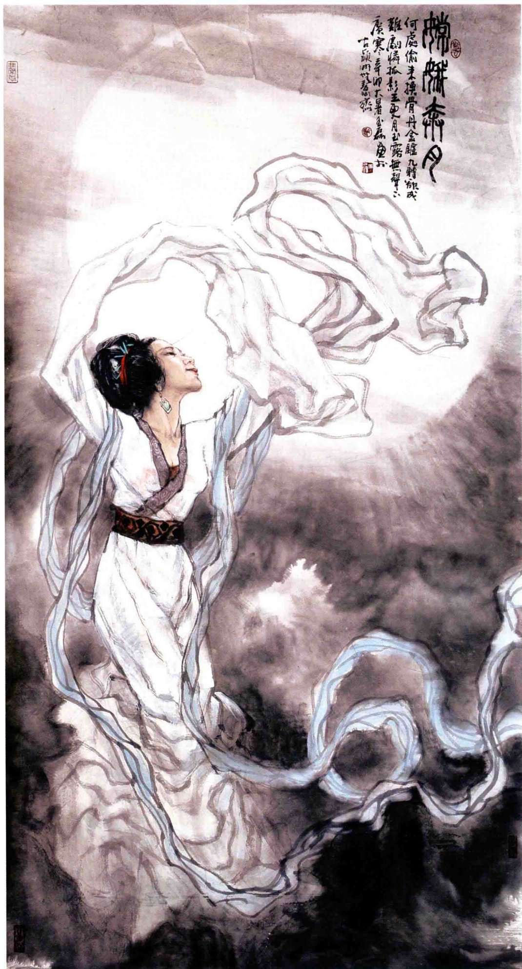
嫦娥奔月 / 2011年 / 纸本 / 180cm × 96cm