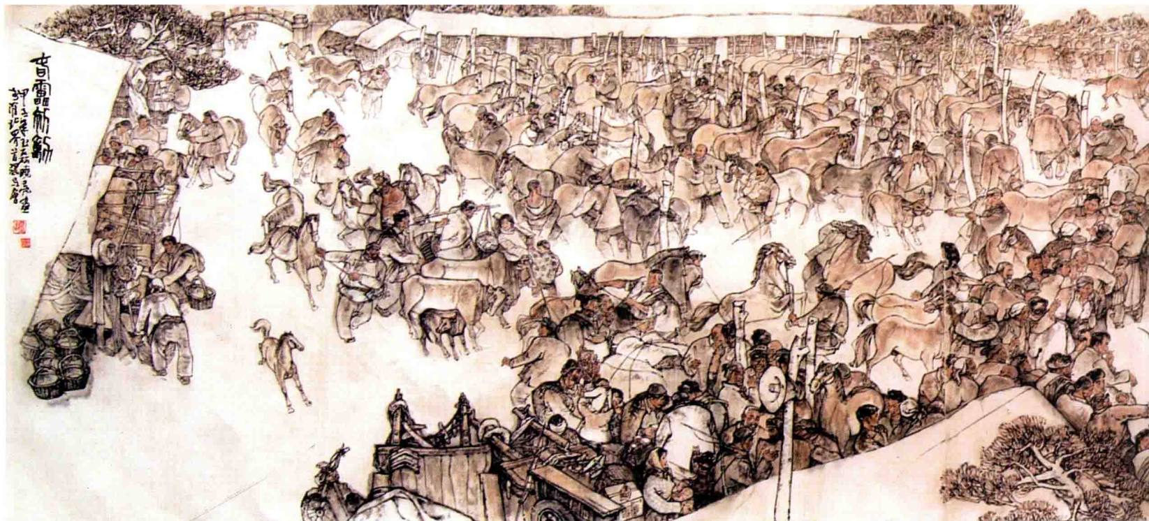
春雷初动 (合作) / 1984年 / 纸本 / 120cm × 480cm