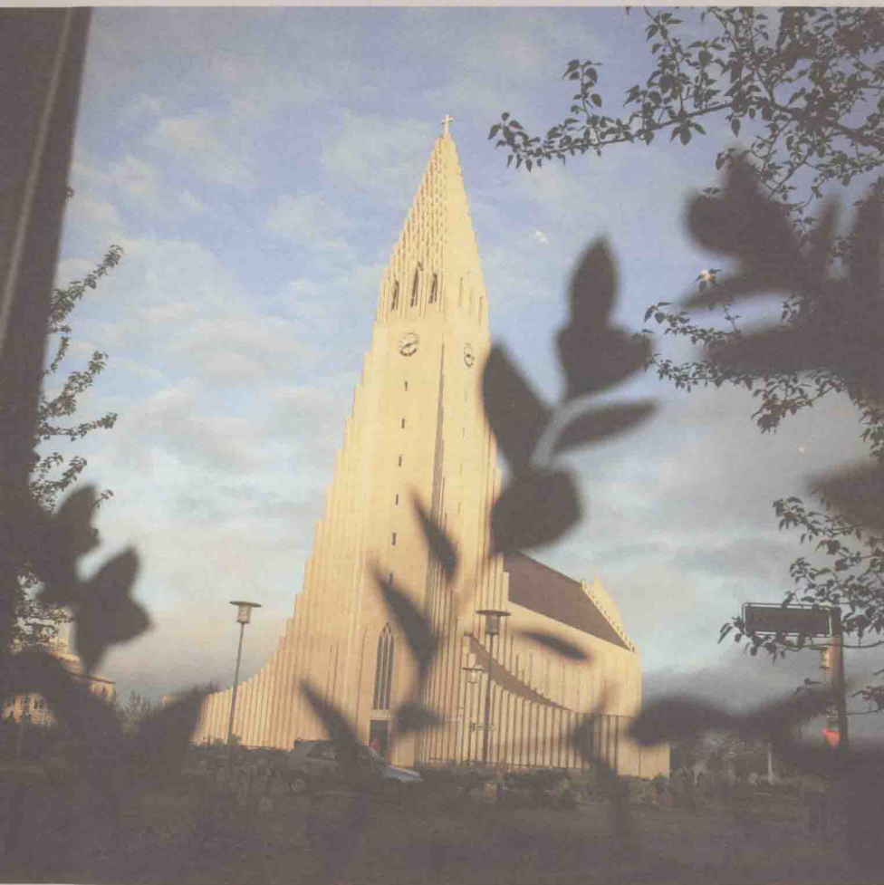
雷克雅未克大教堂