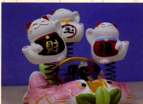
F14的光圈拍摄，画面较暗

在其他条件都相同的情况下，光圈越大画面进光量越大，画面也就越亮，画面的景深也就越浅。很多小清新照片背景朦胧虚幻，就是用大光圈镜头实现的。