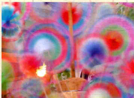
2s的快门速度，产生动感