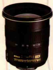
尼康 AF-S 12-24mm 1 : 4G ED

3. 特殊镜头分类：专门用于微距拍摄的微距镜头；可以将平面视角内 180° 圆弧视野全部收入画面的鱼镜头；可以调整所拍摄影像透视关系的移轴镜头等。