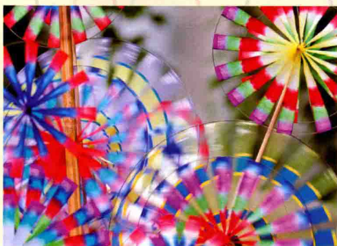
1/100s的快门速度，定格瞬间