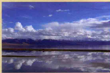
广角镜头展现风光的开阔感