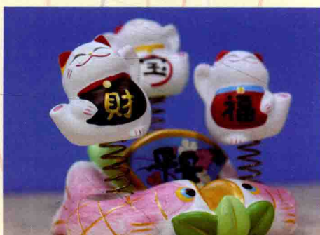
F5.6的光圈拍摄，画面变亮

2. 快门速度：快门是相机中挡在感光元件前的黑色挡片，当拍摄者按下快门按钮后，快门会经历一开一合，相机的感光元件就会记录快门开合中的画面。快门一开一合的速度，就是所谓的快门速度。