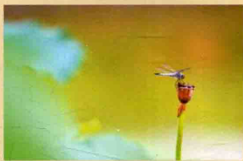
微距镜头可以近距离拍摄微小景物