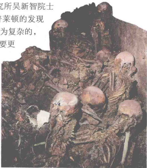
随着越来越多的早期人类化石的发现，“走出非洲说”与“多地区进化说”之争也愈演愈烈。

现代人究竟是“走出非洲”还是“多地区进化”呢？根据目前所掌握的证据，我们现在还只能是推测，不能完全确定，更加准确、权威的结论，只能等待更多的考古和科学发现之后才能确定。