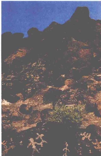
除了石器，岩画也被看作是远古人类留下的遗迹。

“神秘石块”到底是古人类留下的石器，还是远古啮齿类动物的磨牙石块，这对于研究宝兴县境内乃至整个青衣江流域的人类文明有着深远意义。但资料有限，我们只能期待以后有更多、更全面的考古发现，使这些石块的真实身份早日大白于天下。