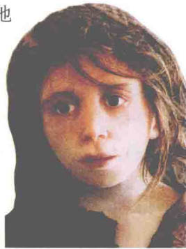
“露西少女”的复原图。

科学家推算“露西”是一位20多岁的女性，大约生活在320万年前，重约40千克，身高在1.2米左右，生过孩子。经过测量，人类学家发现露西的脑容量只有400毫升，大脑还未充分进化。由于这个发现，科学家建立起了人类祖先在大脑充分进化前就已开始直立行走的观点。