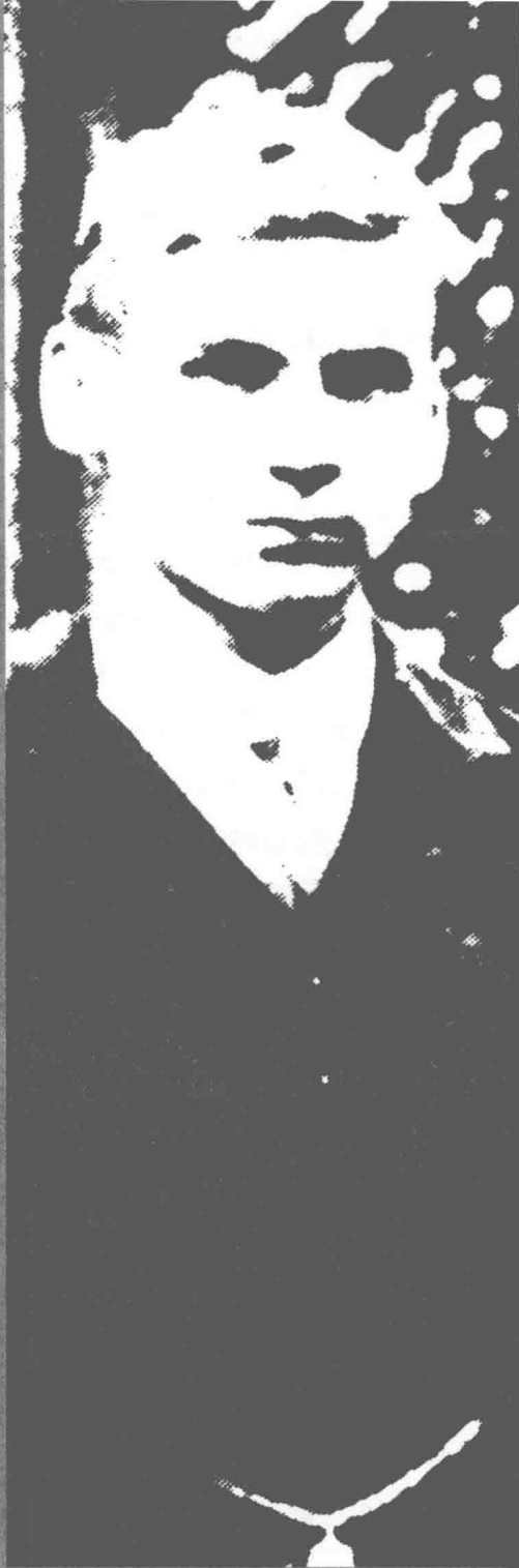
1904年，在圣保罗学习时的蒙哥马利。

THE LIST OF BRITISH GENERALS IN WORLD WAR II