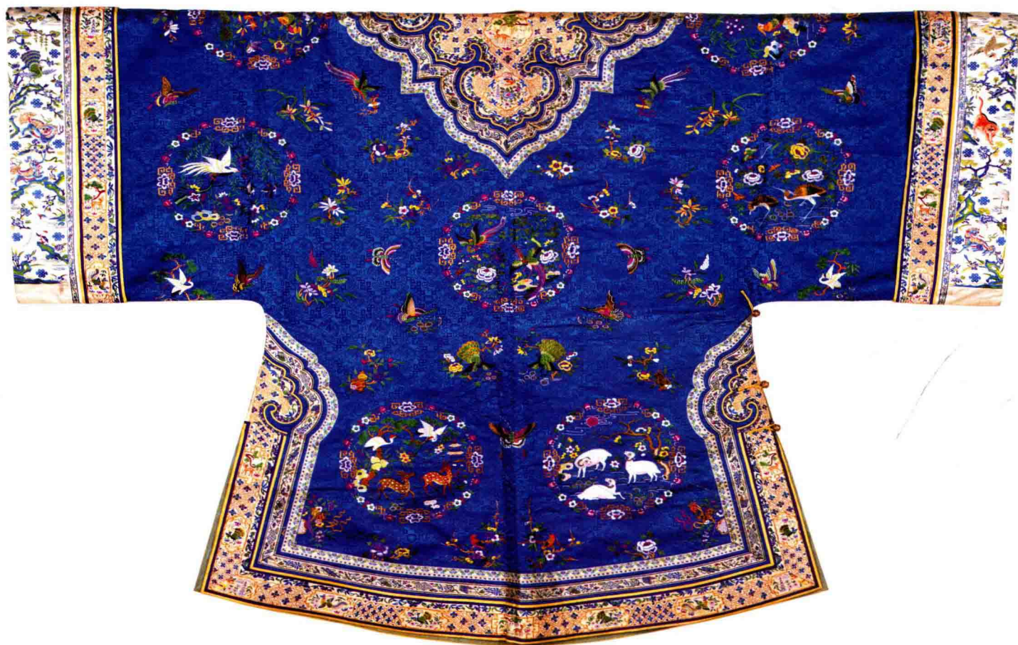
五彩团花鸟禽纹女袍