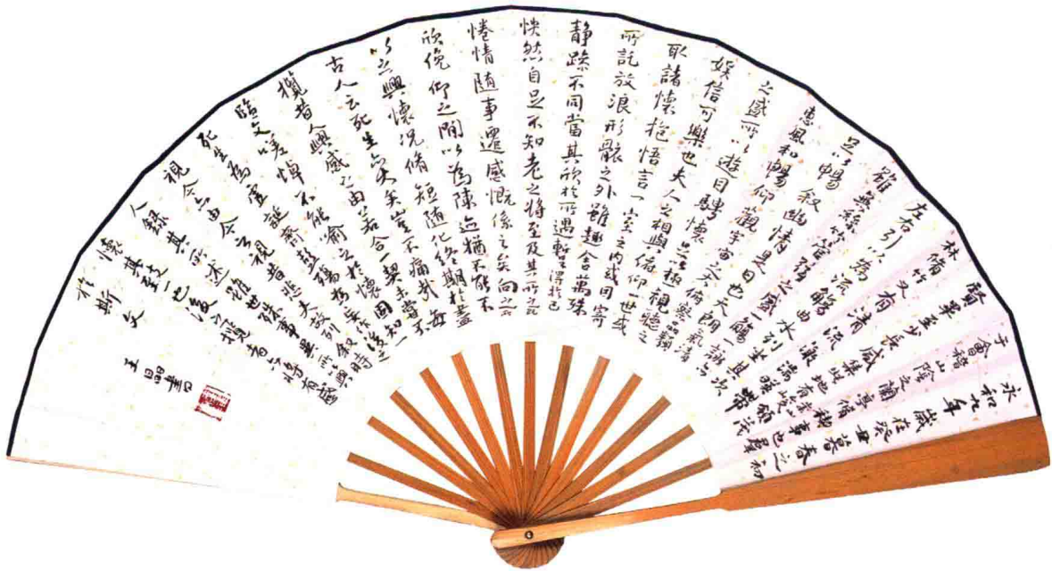
王羲之兰亭序 20cm×60cm 2013年