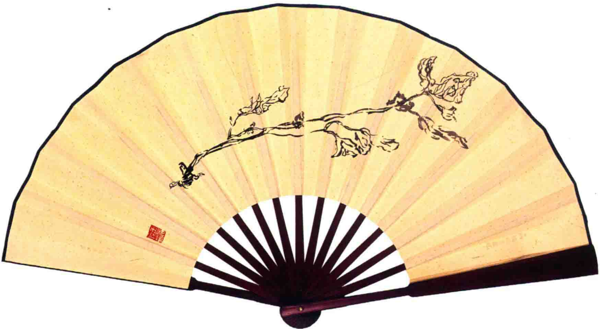
花卉 20cm×60cm 2012年