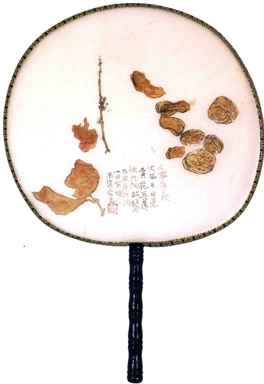
只向故枝开 23cm×24cm 2009年