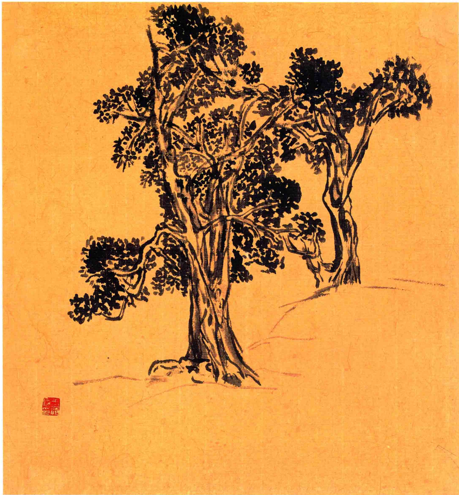
树 46cm×42cm 1997年