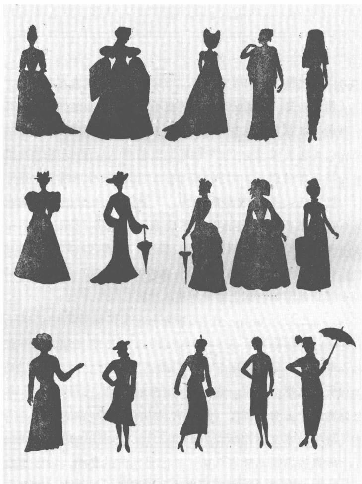
《五千年妇女服饰演进》，《家》1947年第221期

记》也说，比如像京华衣衫的袖子，原本“腋窄而中宽，谓之鱼肚袖，行时飘曳，亦有致。后乃慕南式而易之，则又紧抱腕臂，至不能屈伸”。这里的“南式”，当然也指上海之式了。