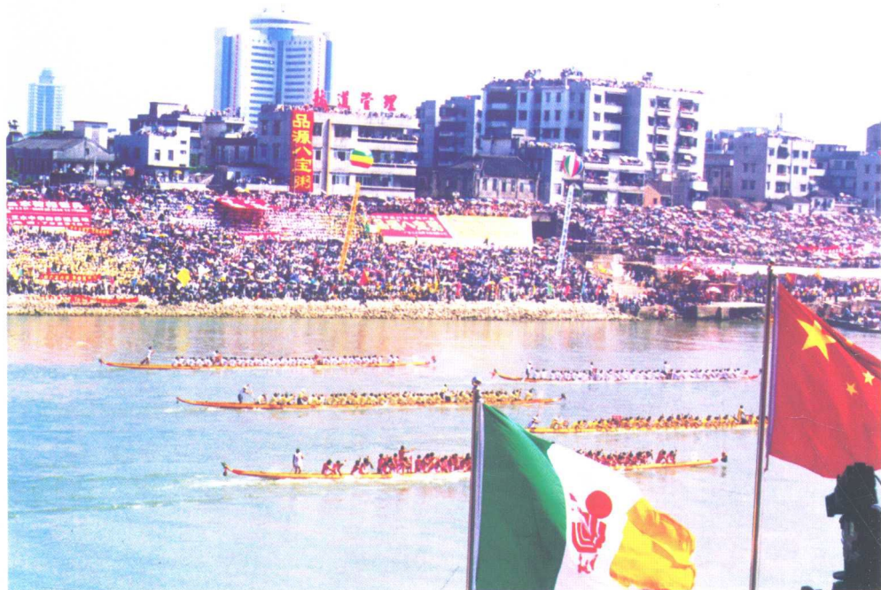
1999年，在广东三水举办的世界龙舟争霸赛的比赛场面