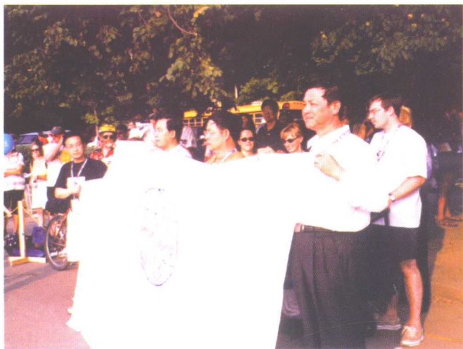
2001年，美国费城举办的第四届世界龙舟锦标赛闭幕式上，上海青浦区政府和体育局的同志接过下一届承办世界龙舟锦标赛的会旗