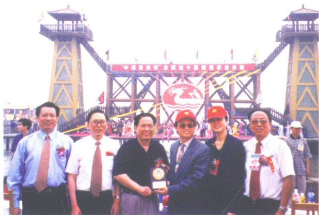
国家体育总局副局长张发强（左三）、中国龙舟协会第二任主席王筱麟（左六）在2000年江苏无锡举办的全国龙舟比赛上与美国龙舟界人士和江苏的同志们在一起