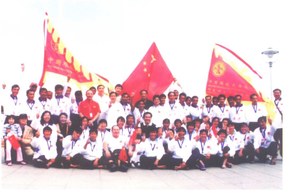
2005年，广东顺德龙舟队组成的中国男女龙舟队在德国柏林举办的第六届世界龙舟锦标赛夺得七项冠军