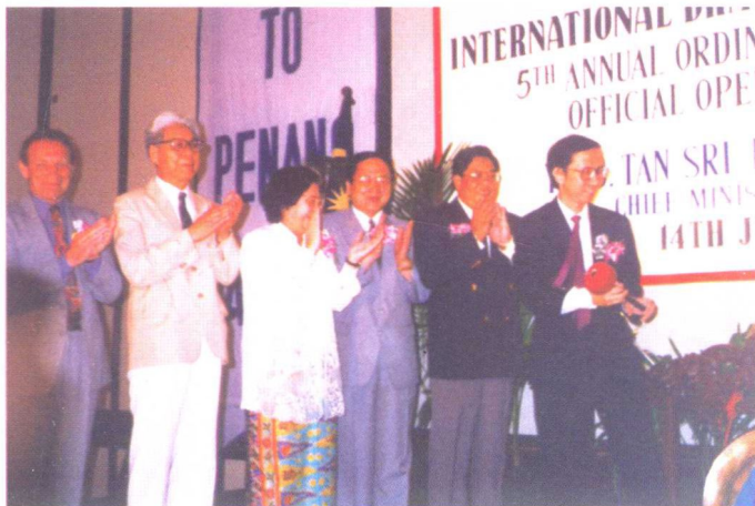
1996年，国际龙舟联合会荣誉主席路金栋（右五）、主席刘吉（右三）以及秘书长麦克（左一）等人在马来西亚举办的国际龙舟联合会会议上留影