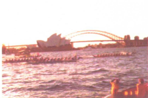
1985年，代表中国出征澳大利亚国际龙舟赛的广东顺德龙舟队决赛中冲刺的一刹那