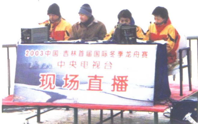
中央电视台为国际冬季龙舟比赛进行现场直播