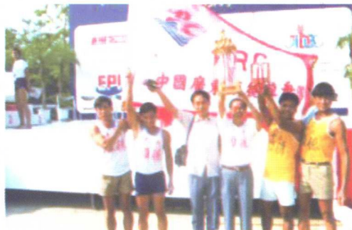
1989年，在日本大阪国际龙舟比赛上获得冠军的广东顺德龙舟队