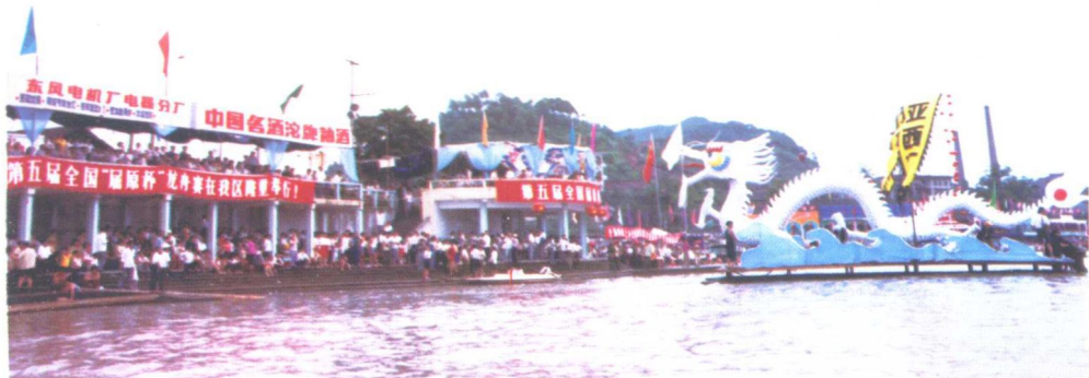
1990年，四川乐山五通桥举办的全国第五届“屈原杯”龙舟赛开幕式