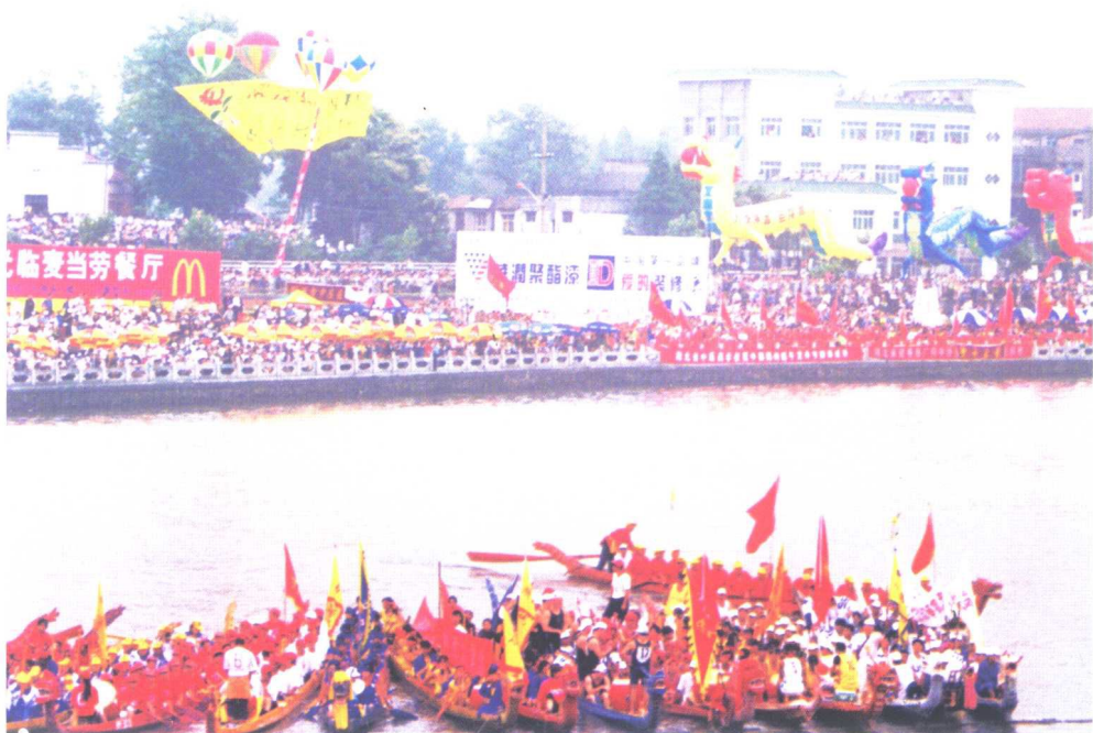
2000年，在湖北荆州举办的国际龙舟邀请赛开幕场景