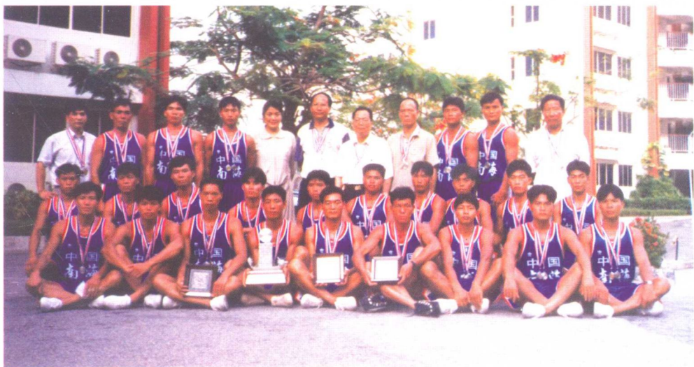
1996年，参加马来西亚滨城举办的国际龙舟比赛的广东南海公安干警龙舟队夺冠后合影