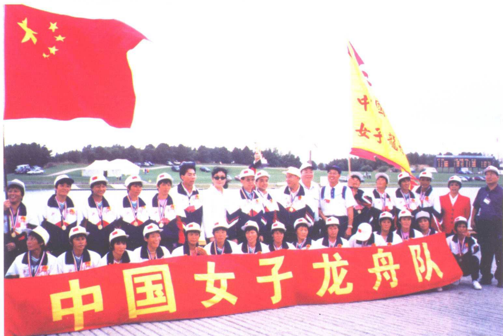
1999年8月，代表中国赴英国诺丁汉参加第三届世界龙舟锦标赛的广东东莞沙田女子龙舟队勇夺3项世界冠军