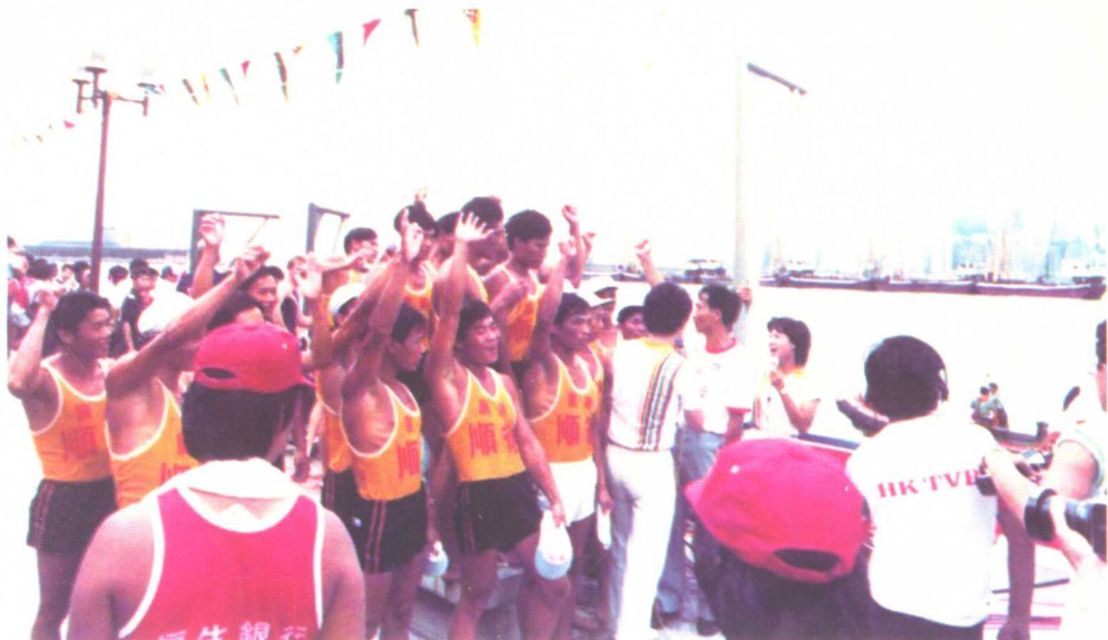
1983年，第一次参加香港国际龙舟邀请赛的中国广东顺德男子龙舟队一举夺魁的情景