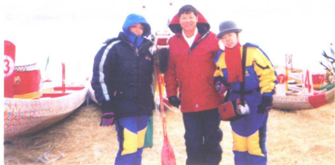
2003年1月，中国龙舟协会工作人员隆冬季节在吉林市松花江冬季国际龙舟邀请赛赛场上