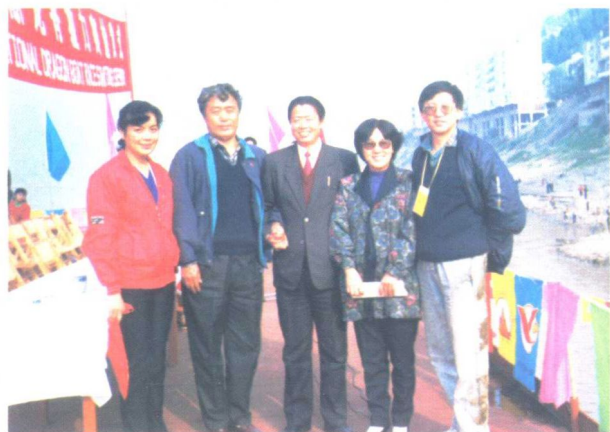
1992年，国家体委群体司司长邱玉才（右三）、中国龙舟协会秘书长李元（右一）、高丰文（左二）、闫树文（左一）等同志在中国长江三峡国际龙舟拉力赛出发地湖北秭归城合影