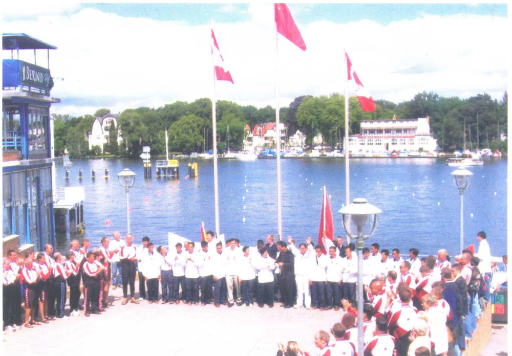
广东顺德龙舟队在2005年德国柏林第六届世界龙舟锦标赛领奖台上