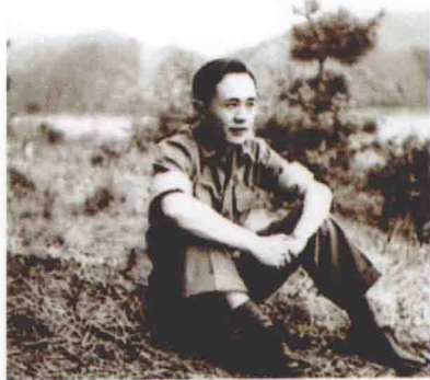
1946 年就读陆军参谋大学时。