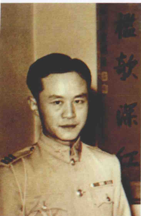
1949年在东京担任中国驻日代表团团长副官。