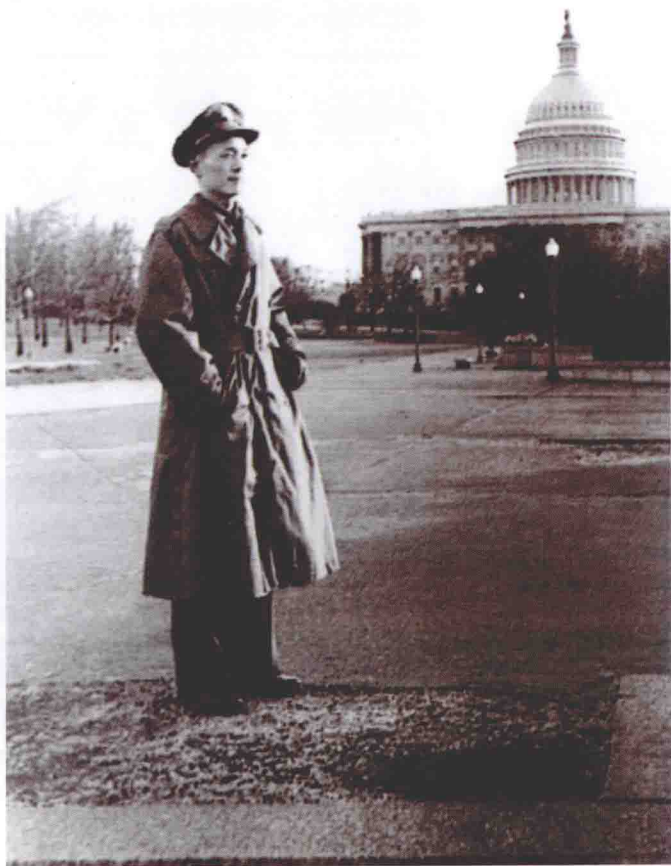
1946 年就读陆军参谋大学时。