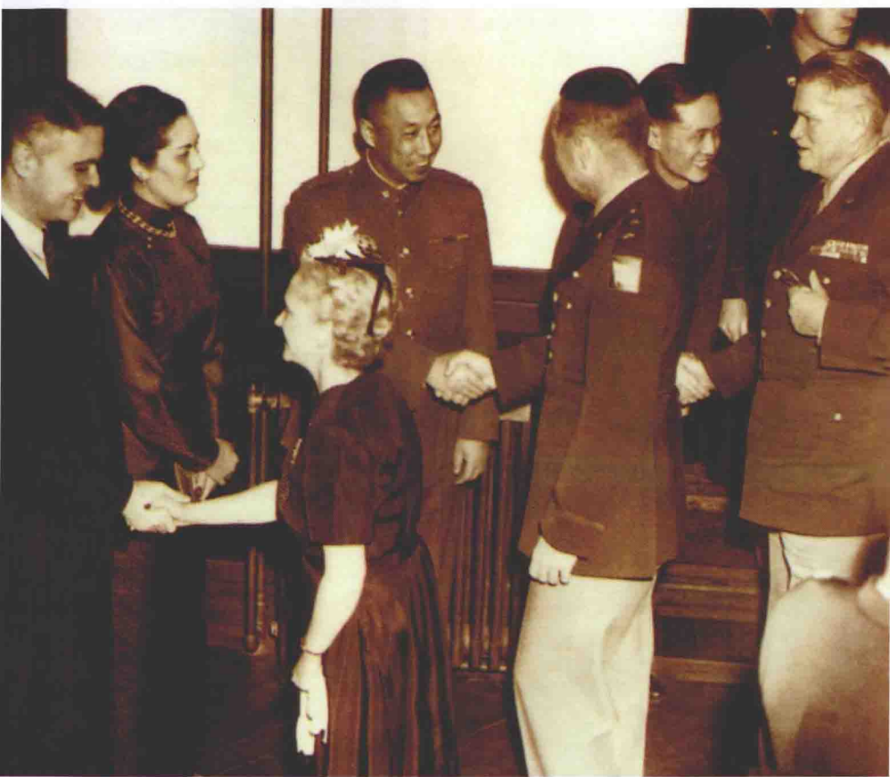
东京中国驻日代表团举行宴会，朱世明将军(中)、何世礼将军(着西装)、黄仁宇(立于门口)与来宾握手致意。