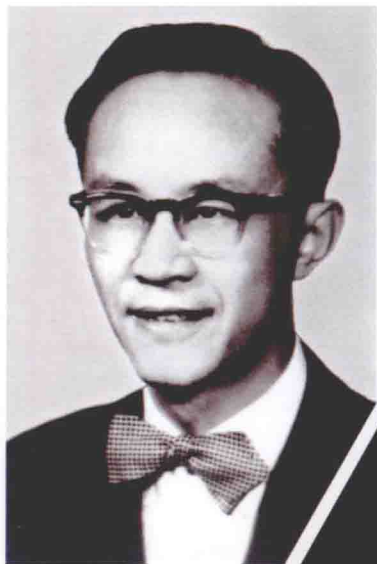
60年代初的年轻学者黄仁宇。