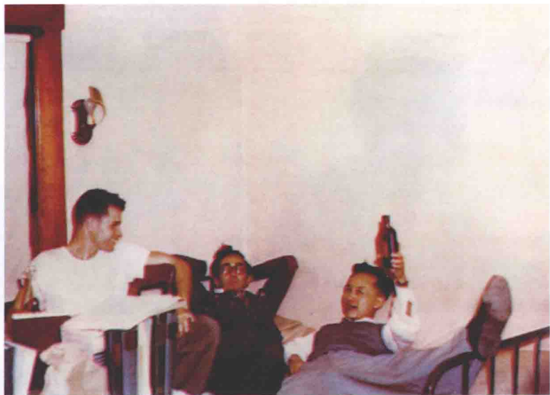
1952年11月10日摄于安亚堡，就读密西根大学时。