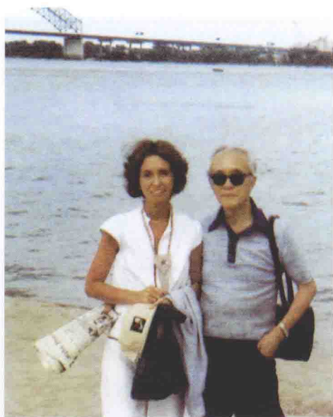
1978年5月，与格尔摄于田纳西州孟菲斯密西西比河河边。