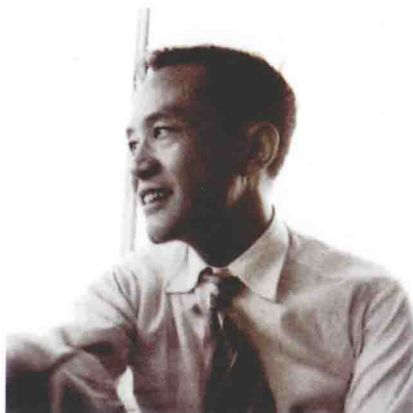
就读密西根大学时。