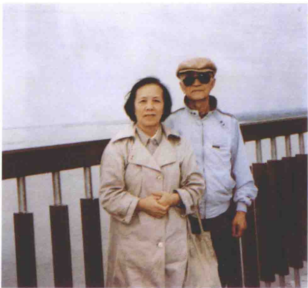
1986年黄仁宇首度回到中国大陆,与妹妹(黄粹存)合影于桂林。