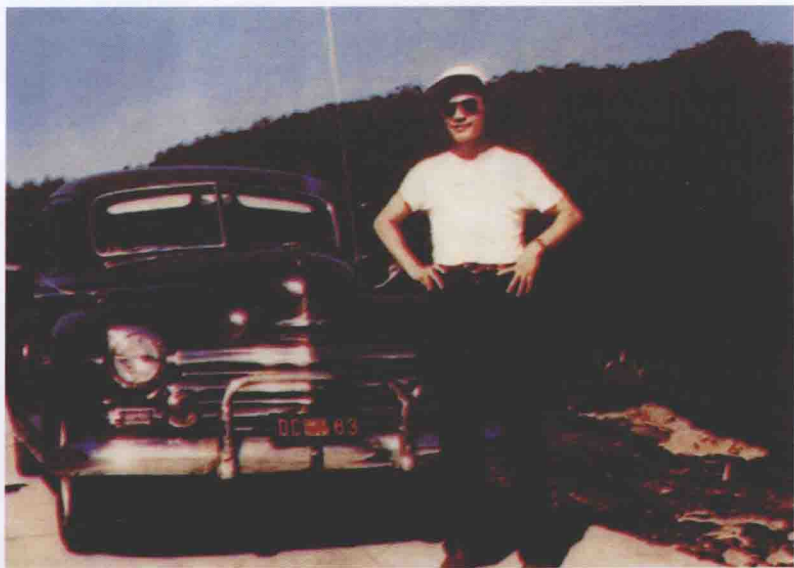
1953年7月20日摄于安亚堡，就读密西根大学时。