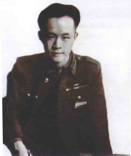
1946年在美国堪萨斯州雷温乌兹要塞就读陆军参谋大学。正在进行地图演练。