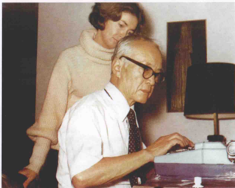
1979年，在纽普兹家中，与格尔共同校阅手稿。