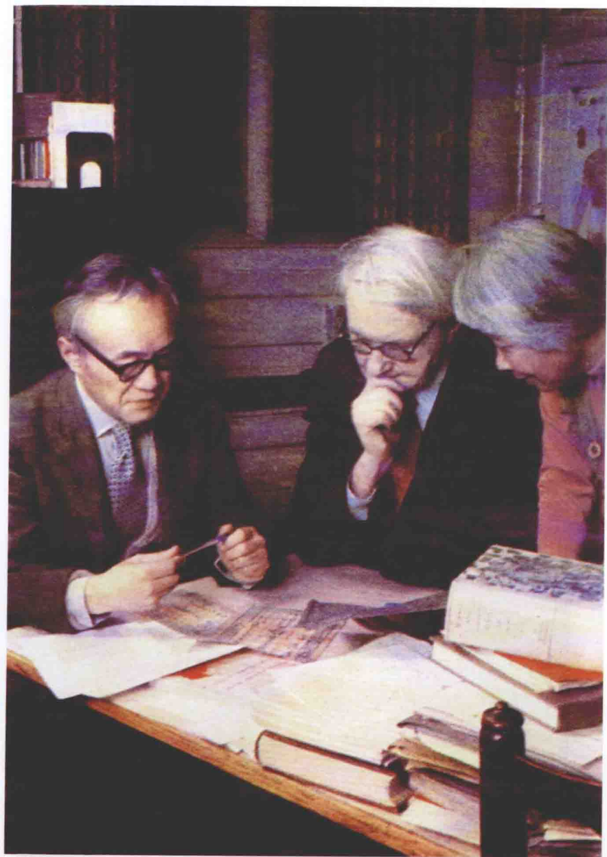
1973年英国《观察家》(Observer)周刊，以李约瑟博士、鲁桂珍博士和黄仁宇博士三人为封面，做特别报道。