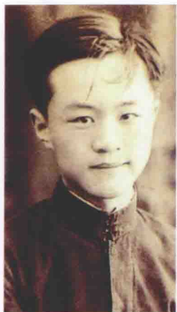
在长沙读高中时， 年约18岁。