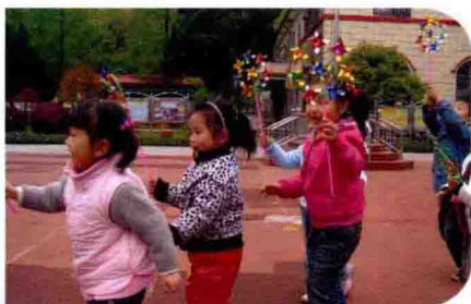
与科学整合的小班体育活动 《风车转转转》