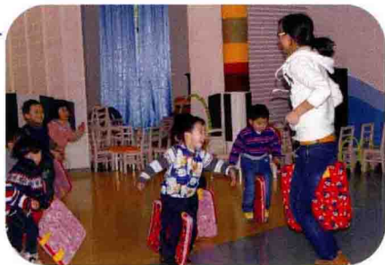
大班室内体育活动 《赛龙舟》 ▼