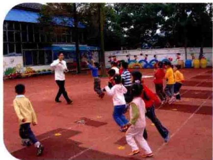
与语言整合的大班体育活动 《快速反应》