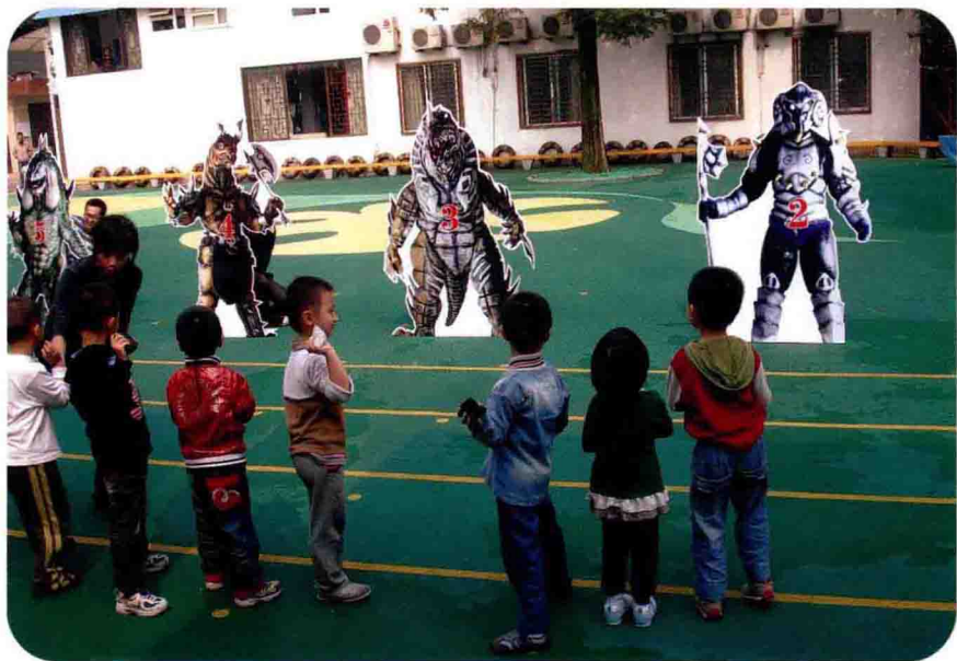
与社会整合的中班体育活动《特殊使命》