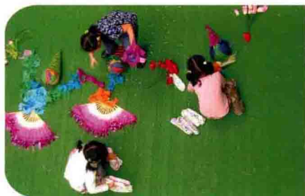
与艺术整合的大班体育活动 《新新人类》