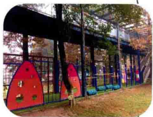
集文化与运动 于一体的奥运长廊