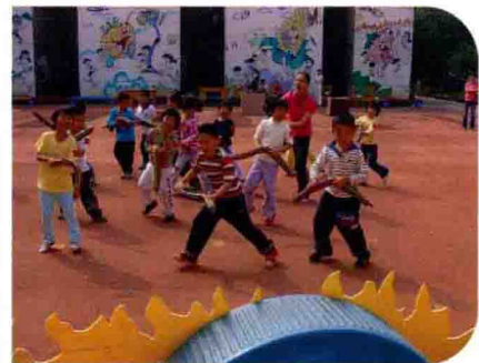
与社会整合的大班体育活动 《紧急出动》