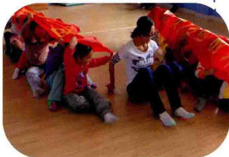
大班室内体育活动 《赛龙舟》 ▼