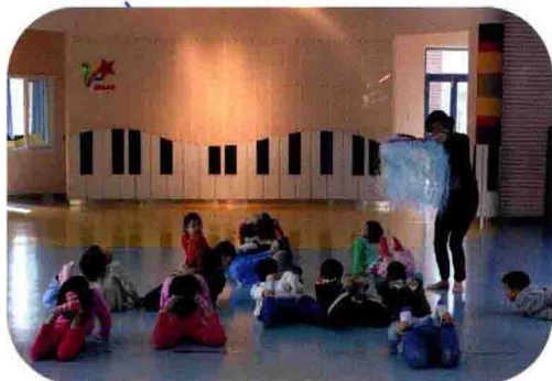
大班室内体育活动 《柔美的水滴》 ▼