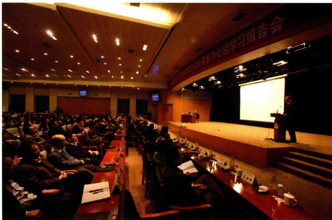
2012年3月12日，举办研究院处两级中心组学习报告会