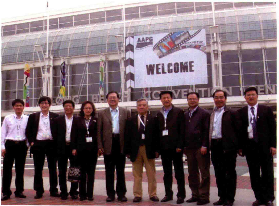
2012年4月，研究院组团赴美参加AAPG年会