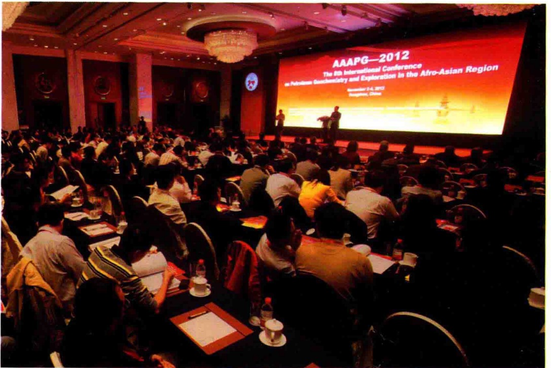
2012年11月2日至4日，承办第八届亚非石油地球化学与勘探国际会议