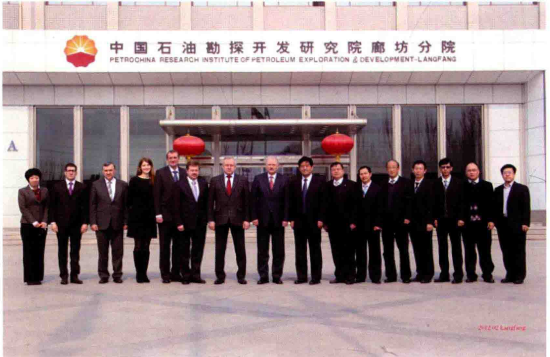
2012年2月28日，俄罗斯天然气科学研究院代表团访问廊坊分院