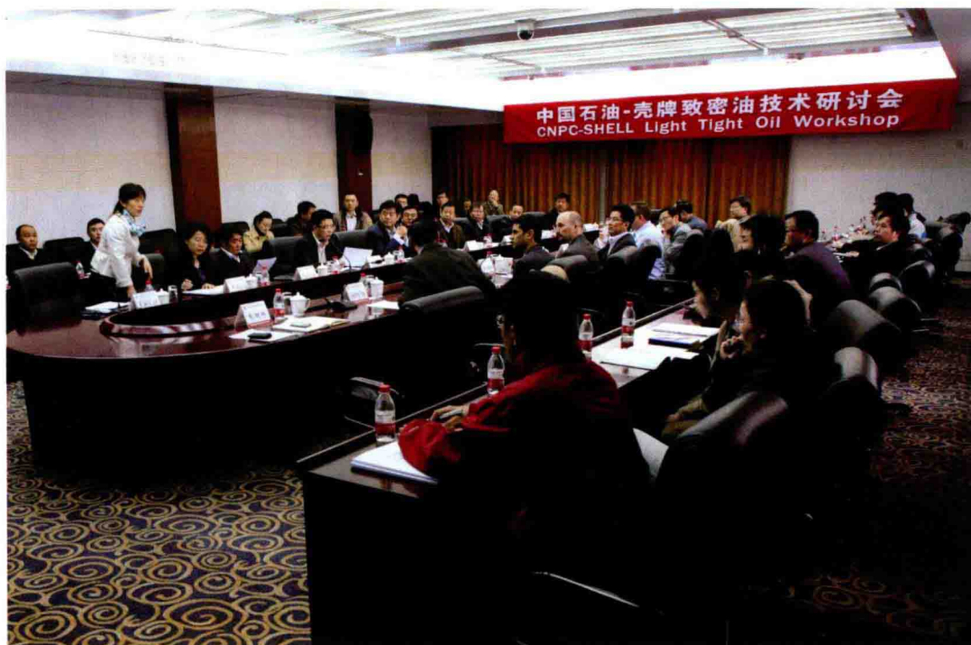
2012年3月27日，召开中国石油-壳牌致密油技术研讨会