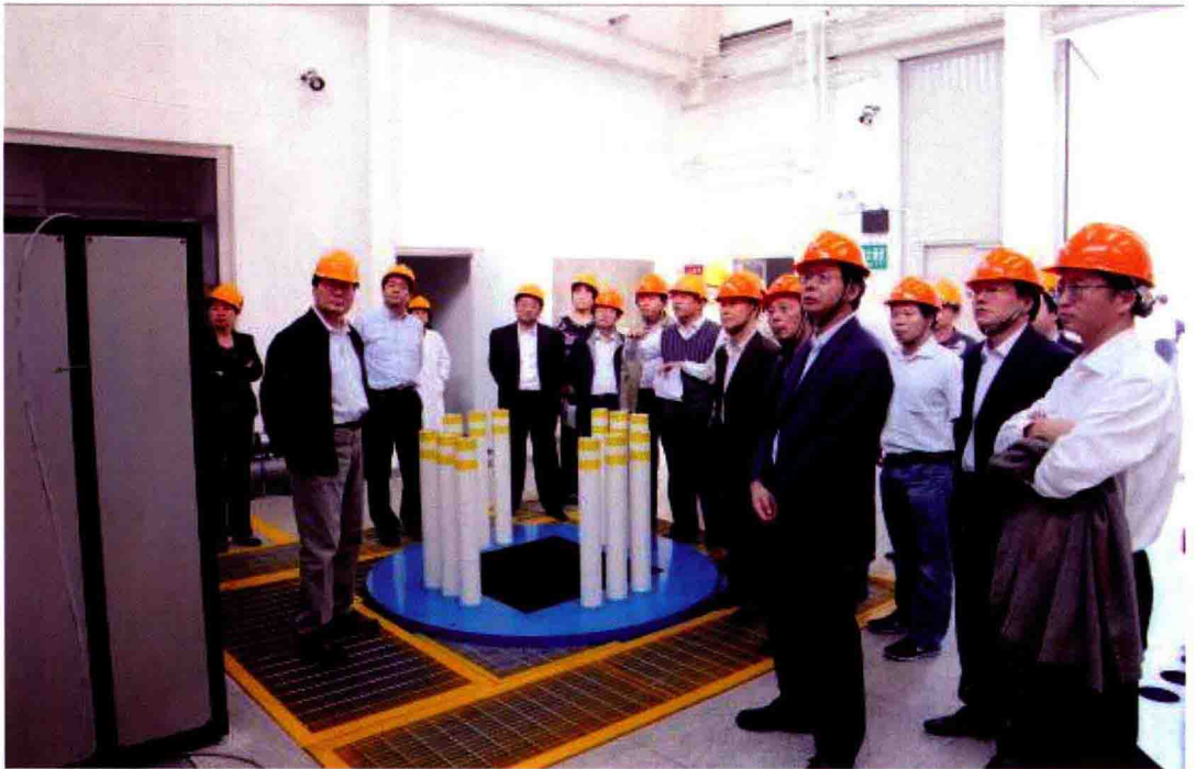
2012年10月12日，国家重大专项监督评估组实地调研研究院承担专项工作