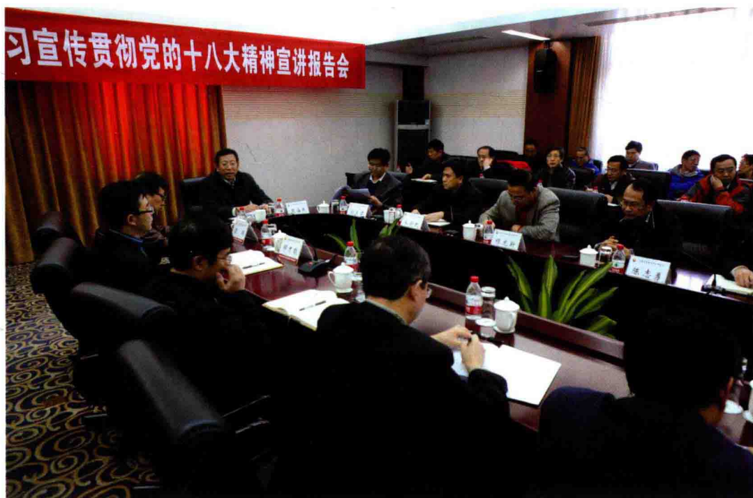
2012年12月3日，举办学习宣传贯彻党的“十八大”精神宣讲报告会