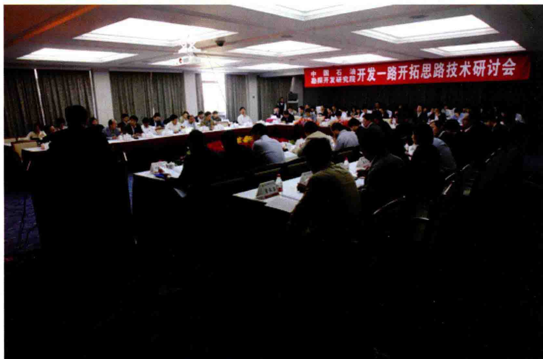
2012年5月2日，召开开发一路开拓思路技术研讨会