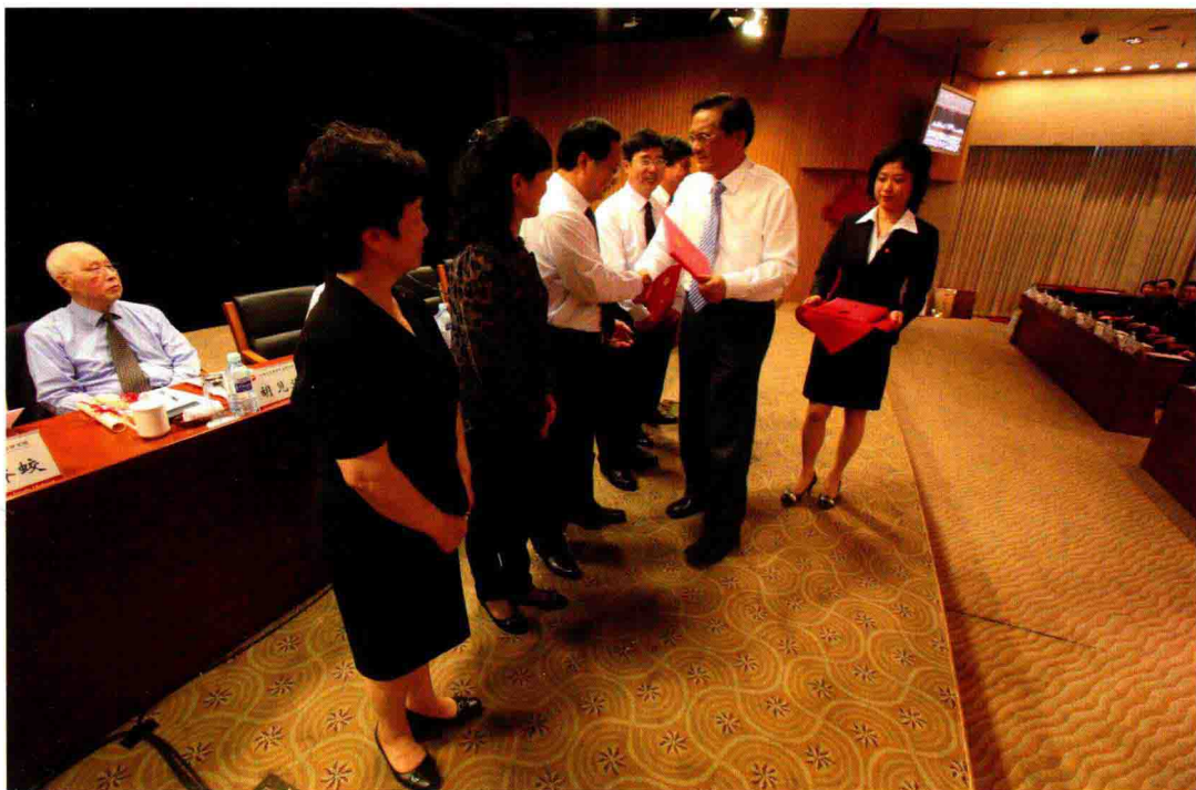
2012年5月4日，召开纪念建团90周年暨“五四”表彰大会