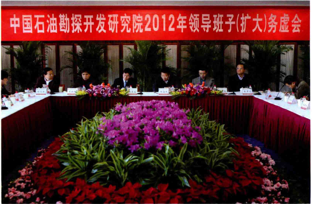
2012年2月8日至9日，召开研究院2012年领导班子（扩大）务虚会