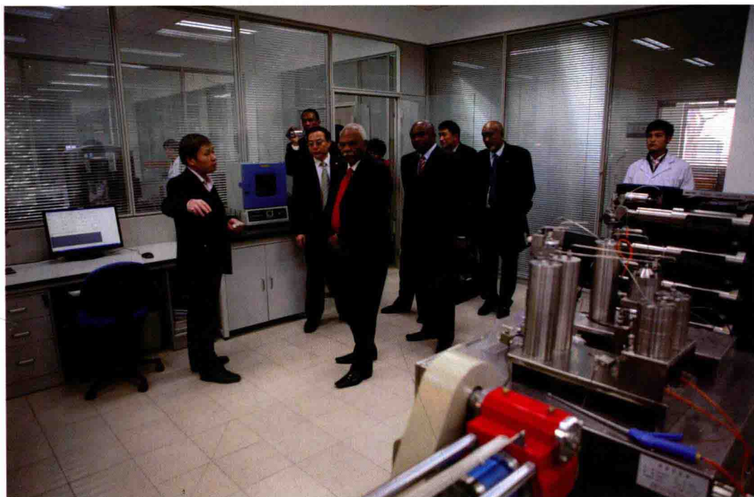
2012年3月16日，苏丹石油部长代表团来院访问交流