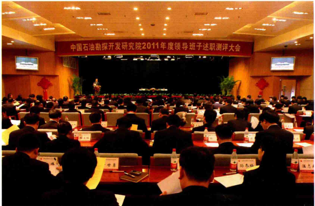
2012年2月14日，召开研究院2011年度领导班子述职测评大会