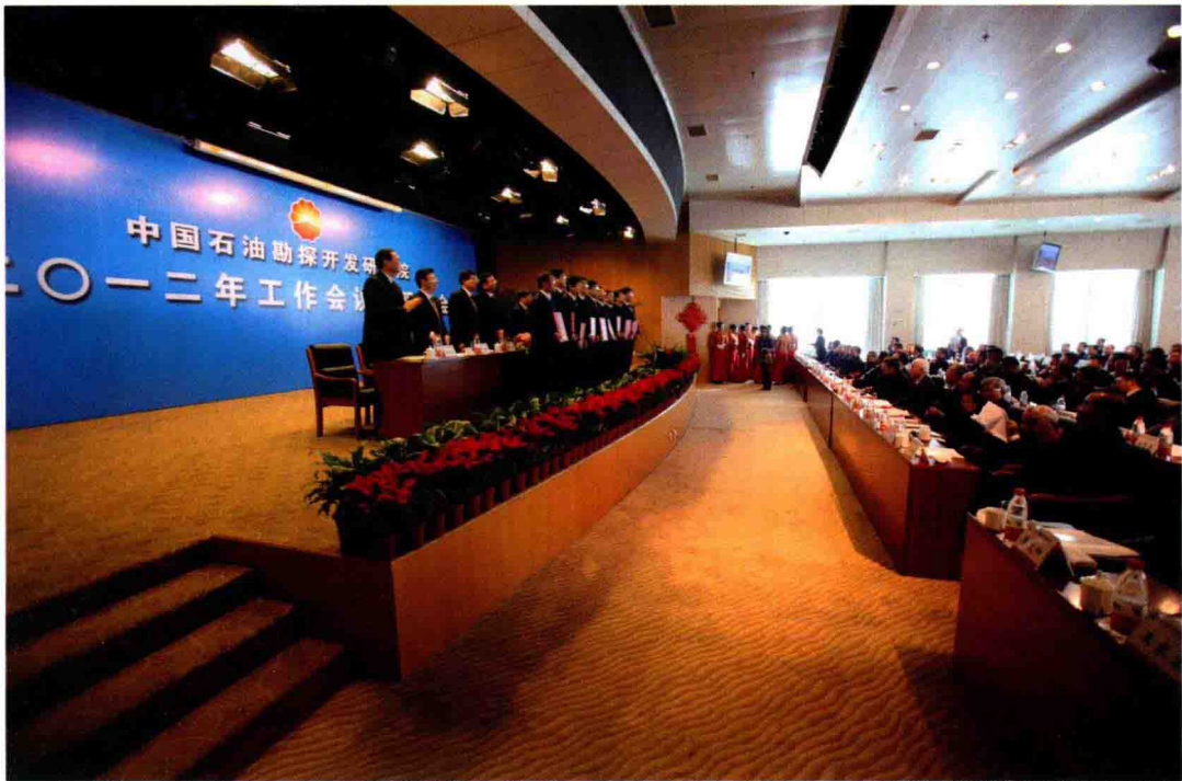
2012年1月13日，召开研究院2012年工作会议暨职代会