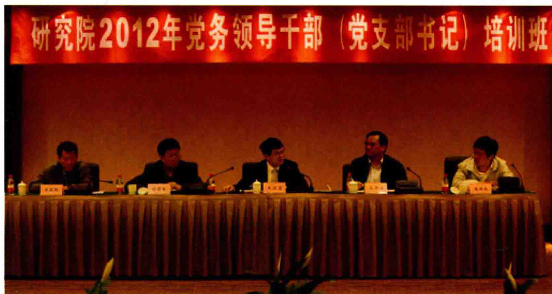
2012年4月14日至25日，举办党务领导干部（党支部书记）培训班