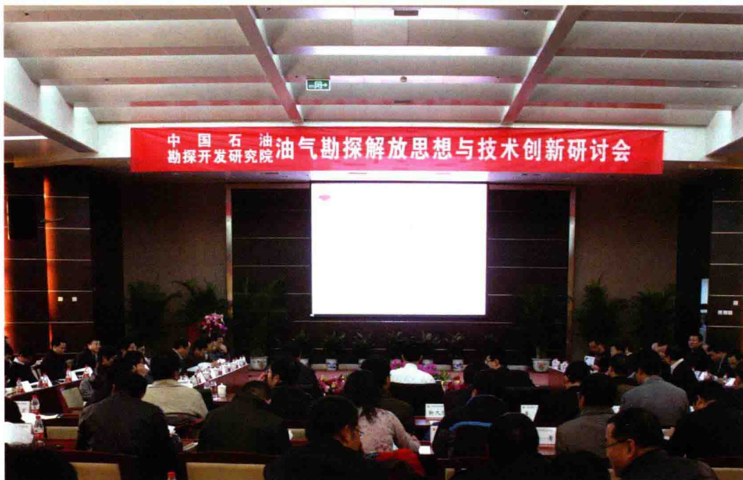
2012年2月15至16日，召开研究院油气勘探解放思想与技术创新研讨会