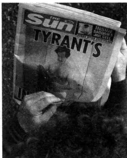
读者观看萨达姆在监狱中半裸的照片

隐私在更大范围和程度上被公众了解。但对于公众人物的某些私事,公众的知情权也是有限的,否则也是侵权。例如,萨达姆在监狱中半裸的照片被公开,就受到公众的强烈谴责。 ①