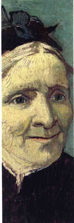
《梵高母亲肖像》（局部） Portrait of the Artist's Mother 1888