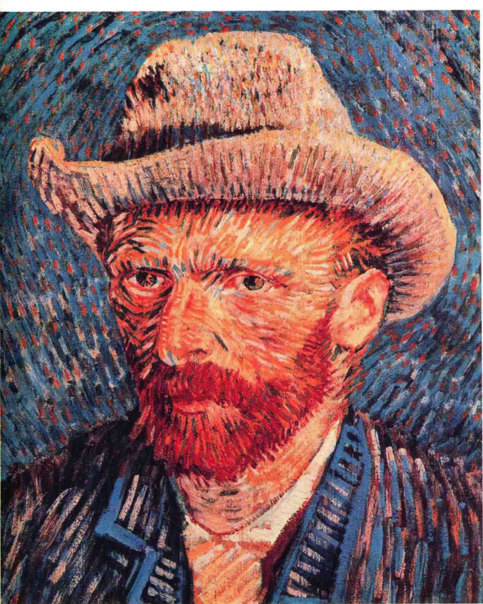
文森特·威廉·梵高 Vincent Willem van Gogh 1853—1890