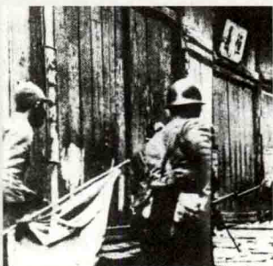
日军攻入亚罗士打

1943年8月，日本按照当初与泰国签订的协议，将马来亚北部的吉打、玻璃市、吉兰丹和丁加奴交给泰国政府。 ①