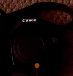
佳能EF 100-400mm f/4.5-5.6L IS USM