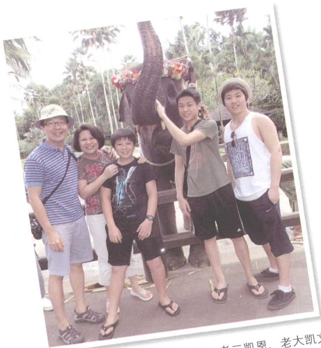
左起：为千、佩蓉、老三凯安、老二凯恩、老大凯文

我们希望从休止中出来后，能重新振奋，再度焕发勃勃生机。我们要为人生的下一个目的地和新篇章全力以赴。