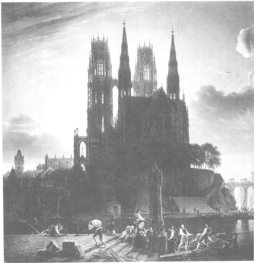
卡尔·弗里德里希·申克尔 河边的哥特式教堂，1813年