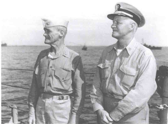
1945年，马克·A·米切尔海军中将（美军快速航母部队指挥官）与切斯特·W·尼米兹海军五星上将（太平洋舰队司令）于关岛附件海面的舰艇甲板上。

在尼米兹任最高行政长官期间，哈尔西一直任劳任怨。他最初担任驱逐舰舰长，是驱逐舰领域的权威，随后他的领域转移到航空母舰。哈尔西思维不够缜密，