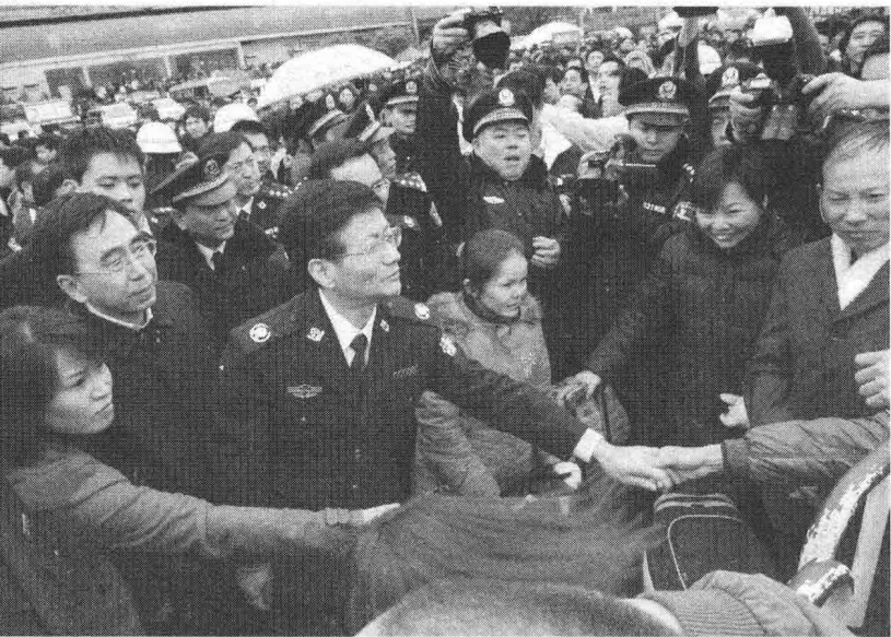
2008年1月27日，国务委员、公安部部长孟建柱（前排左三）到广州检查春运安保工作

随着旅客不断增多，展馆内维护秩序的警力严重不足，春运指挥部立即调遣一百五十名警力赶去增援。到早晨六点，流花展馆转移旅客突破五万，转移行动只好告一段落，两百辆公交车暂时打道回府。