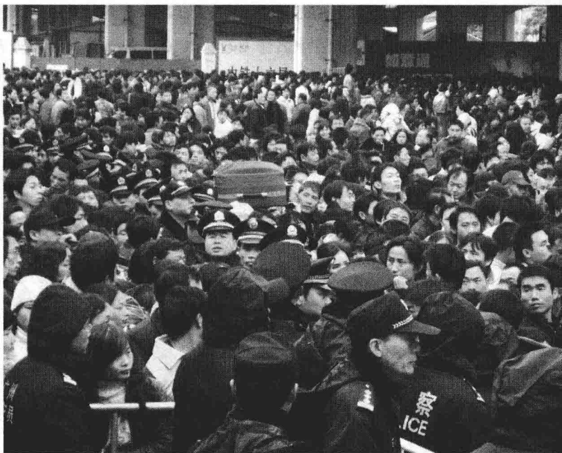
人头攒动的广州火车站广场