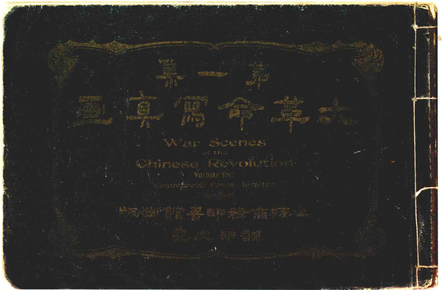
1911年《大革命寫真畫》初版第一集封面